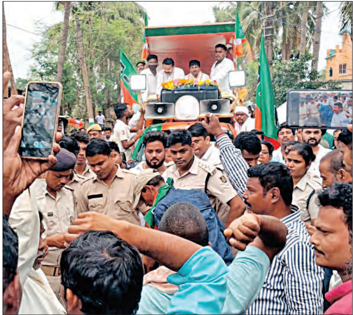
ବିଜୟ-ସମ୍ବଳ ଗୋଷ୍ଠୀ ମୁହାଁମୁହିଁ ଭର୍ତ୍ତୃହରିଙ୍କୁ ଚାକିରି ବିରୋଧ ୪ଟି ସ୍ଥାନରେ ଭର୍ତ୍ତୃହରି ହଟା, ୨ଟି ଆନା ପୁଲିସ ନାକେଦମ୍ ସଭା ନ କରି ଯେଉଁଠି ବିଜେପି ଲୋକସଭା ପ୍ରାର୍ଥୀ ଭର୍ତ୍ତୃହରି

କଟକ/ବଡ଼ମ୍ପା, ୧୧/୪ (ସମ୍ବିଧ): ବିଜେପିରେ ୨୬ ବର୍ଷ ସଂସଦ ଥିବା ଭର୍ତ୍ତୃହରି ଦଳ ଛାଡ଼ି ଏବେ କଟକ ଲୋକସଭା ଆସନ ପାଇଁ ବିଜେପି ପ୍ରାର୍ଥୀ। ମାତ୍ର ଲୋକସଭା ଆସନ ଅଧୀନସ୍ଥ ବିଭିନ୍ନ ଅଞ୍ଚଳର ବିଜେପି କର୍ମୀ ତାଙ୍କୁ ଗ୍ରହଣ କରିବାକୁ ନାହାନ୍ତି। ଗତକାଳି ଖଣ୍ଡପଡ଼ା ଅଞ୍ଚଳରେ ଭର୍ତ୍ତୃହରି ହଟା ହୋଇଥିବାବେଳେ ଆଜି ବଡ଼ମ୍ପା ଅଞ୍ଚଳରେ ତାକୁ ବିରୋଧର ସମ୍ମୁଖୀନ ହୋଇଛନ୍ତି। ଦଳର ଲୋକସଭା ପ୍ରାର୍ଥୀଙ୍କ ବିରୋଧରେ ବିଜେପି କର୍ମୀମାନେ ଖୋଲାଖୋଲି ପଦାକୁ ବାହାରିଛନ୍ତି। କଟକ ଜିଲ୍ଲା ବିଜେପି ଏବେ ବିଭିନ୍ନ ଭାଗରେ ବିଭକ୍ତ ହୋଇ ଯାଇଛି। ବଡ଼ମ୍ପାରେ ବିଜେପି କର୍ମୀମାନେ 'ଗୋ-ବ୍ୟାକ୍' ଭର୍ତ୍ତୃହରିଙ୍କୁ ଗୋପନୀୟ ଭାବେ ଚାକିରି ବିରୋଧ କରିଛନ୍ତି। ଘରେ ପଶୁ ପଶୁ ମୁଣ୍ଡରେ ଚାକିରି ବିରୋଧ ଆରମ୍ଭ ପ୍ରଚାର ମଇଦାନରେ ବିରୋଧ ଭର୍ତ୍ତୃହରିଙ୍କ ମନରେ ଛନ୍ଦନ ପୂରାଇଛି।