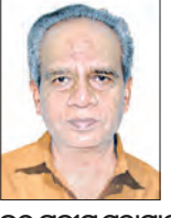
ଉତ୍କଳ ପ୍ରବାସ ମହାପାତ୍ର