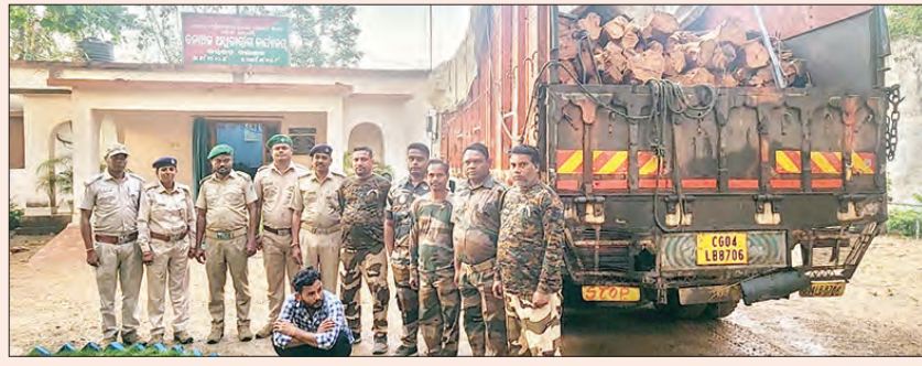
ଜବତ କାଠ ତୁଙ୍ଗୁରିପାଲିରୁ ସମ୍ବଳପୁର, ଝାରସୁଗୁଡ଼ା ଦେଇ ହିମାଚଳପ୍ରଦେଶକୁ ଚାଲାଣ ହେଉଥିବା

ବରଗଡ଼ ବନବିଭାଗ ଦ୍ଵାରା ହିମାଚଳ ପ୍ରଦେଶକୁ ଚାଲାଣ ହେଉଥିବା ଲକ୍ଷାଧିକ ଟଙ୍କା ମୂଲ୍ୟର ଖଜରକାଠ ଜବତ କରାଯିବା ସହ ଜଣେ ବ୍ୟକ୍ତିକୁ ଗିରଫ କରାଯାଇଛି। ସିଡି ୦୪ ଏଲବି ୮୭୦୬ ନମ୍ବର ଟ୍ରକ ଯୋଗେ ସୁବର୍ଣ୍ଣପୁର ଜିଲ୍ଲା ତୁଙ୍ଗୁରିପାଲିରୁ ବିପୁଳ ପରିମାଣର ଖଜରକାଠ ଚାଲାଣ ହେଉଥିବା ବେଳେ ବରଗଡ଼ ବନବିଭାଗ ତରଫରୁ ଅବିରା ନିକଟରୁ ଜବତ କରାଯାଇଥିଲା। ଉକ୍ତ ଟ୍ରକରେ ୧୮ ଟନ ଖଜରକାଠ ଥିବା ବେଳେ ତାର ଆନୁମାନିକ ମୂଲ୍ୟ ୧୮ ଲକ୍ଷ ଟଙ୍କା ହେବ ବୋଲି ଜଣାପଡ଼ିଛି।