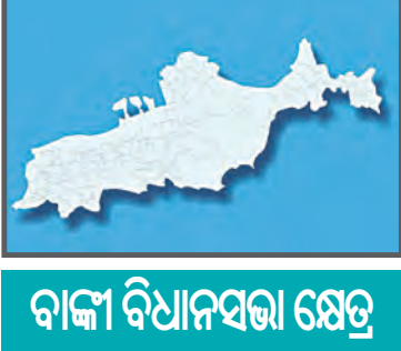
ବାଙ୍କା ବିଧାନସଭା କ୍ଷେତ୍ର