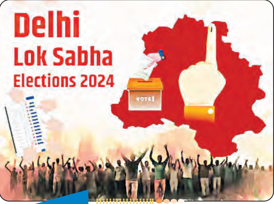
ଦିଲ୍ଲୀ : ମୋଟ ଆସନ ସଂଖ୍ୟା ୦୭

୨୦୨୪ ଲୋକସଭା ନିର୍ବାଚନ ପରିପ୍ରେକ୍ଷୀରେ ରାଷ୍ଟ୍ରୀୟ ରାଜଧାନୀ ଦିଲ୍ଲୀରେ ଷଷ୍ଠ ପର୍ଯ୍ୟାୟରେ ମେ' ୨୫ରେ ମତଦାନ ହେବ। ଚାନ୍ଦିନୀ ଚୌକ, ଉତ୍ତର ପୂର୍ବ ଦିଲ୍ଲୀ, ପୂର୍ବ ଦିଲ୍ଲୀ, ନୂଆଦିଲ୍ଲୀ, ଉତ୍ତର ପଶ୍ଚିମ ଦିଲ୍ଲୀ, ପଶ୍ଚିମ ଦିଲ୍ଲୀ ଏବଂ ଦକ୍ଷିଣ ଦିଲ୍ଲୀ ଭଳି ୭ଟି ଲୋକସଭା ଆସନକୁ ନେଇ ମତଦାନ ହେବାକୁ ରହିଥିଲେ ହେଁ ଏଠାରେ ସେଭଳି ରାଜନୈତିକ ଉତ୍ତୁକତା ଦେଖାଯାଇ ନାହିଁ। କାରଣ ଏଠାକାର ଶାସକ ଆମ ଆଦମା ପାର୍ଟି(ଆପ)ର ସ୍ଥିତିକୁ ନେଇ ସେଭଳି ଘଟିକା ଘୋଡ଼ା ହୁଏତରେ ଲାଗିଛି ଚାହାଁ ଏକ ବ୍ୟତିକ୍ରମ ଆଣିଛି ବୋଲି ଭୋଟରଙ୍କ ମହଲରେ ଜୋରଦାର ଚର୍ଚ୍ଚା ଚାଲିଛି।