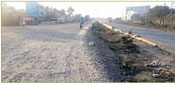
କଟକ-ସମ୍ବଲପୁର ଧଳେନ୍ଦ୍ର ରାଜପଥ ନିର୍ମାଣ କାର୍ଯ୍ୟ ସମ୍ବନ୍ଧରେ ଏହି ମାମଲା ଦାୟର କରାଯାଇଛି। ଆବେଦନକାରୀ ଦର୍ଶାଇଛନ୍ତି ଯେ ଗତ ୨୦୦୫ରେ କେନ୍ଦ୍ର ସରକାର ଏହି ରାସ୍ତା ଉନ୍ନତକରଣ ତଥା ଚାରିଲେନ

୪୦୧ଟି ଦୁର୍ଘଟଣା ଘଟିଛି। ଏହି ଏନ୍ଏଚ୍ଏଆଇକୁ କାରଣ ଦର୍ଶାଉ ନେତୃତ୍ୱ କାରୀ କରାଯାଇ ବୋଲି ଆଗ୍ରହ କରାଯାଇଥିବା ବେଳେ ଏହି ରାସ୍ତା କାମ ପାଇଁ କି ପଦକ୍ଷେପ ନିଆଯିବ ଓ ଠିକାଦାରଙ୍କ ବିରୋଧରେ କ'ଣ କାର୍ଯ୍ୟାନୁଷ୍ଠାନ ନିଆଯାଇଛି ସେନେଇ ଜବାବ ରଖିବାକୁ ନିର୍ଦ୍ଦେଶ ଦିଆଯାଇ ବୋଲି ଆବେଦନକାରୀ ପ୍ରାର୍ଥନା କରିଛନ୍ତି। ଦୁର୍ଘଟଣାରେ ମୃତାହତଙ୍କ ପରିବାରକୁ କ୍ଷତିପୂରଣ ପ୍ରଦାନ ପାଇଁ ପ୍ରାର୍ଥନା କରାଯାଇଛି। ଏହି ମାମଲାରେ ରାଜ୍ୟ ପୂର୍ଣ୍ଣ ସଚିବ, କେନ୍ଦ୍ର ସଚିବ ଓ ପରିବହନ ମନ୍ତ୍ରଣାଳୟ ସଚିବ, କାତାୟ ରାଜପଥ ପ୍ରାଧିକରଣ ଓ ଏନ୍ଏଚ୍ଏଆଇର ଉପରୋକ୍ତ ପ୍ରକଳ୍ପ ନିର୍ଦ୍ଦେଶକଙ୍କୁ ପକ୍ଷରୁ କରାଯାଇଛି।