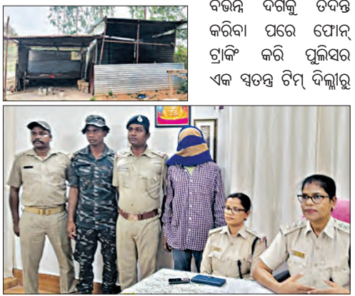
ହରାଶରାମକୁ ଧରିବାରେ ସଫଳ ହୋଇଥିଲା। ଜେରା ସମୟରେ ହରାଶରାମ ହିଁ ନିଶ୍ଚଳ ନାବାଳିକାର ହତ୍ୟାକାରୀ ବୋଲି ସେ ପୁଲିସ ଆଞ୍ଚଳରେ ସାକାର କରିଥିଲା। ପରେ ପ୍ରମାଣ ସହ ଅଭିଯୁକ୍ତ ହରାଶରାମକୁ କୋର୍ଟ ଚାଲାଇ କରାଯାଇ ପୁଲିସ ନାବାଳିକାକୁ ଦୁର୍ଘର୍ମ କରିବା ପରେ କିଭଳି ହତ୍ୟା କରିଥିଲା ସେ ହୁଦୟବିଚାରକ ଘଟଣା ପୁଲିସ ସମ୍ମୁଖରେ ପ୍ରକାଶ କରିଥିଲା।

ଆଜିର ସମାଜରେ ଭଦ୍ରମୁଖା ପିଣ୍ଡା ଯୌନ ପିଣ୍ଡାଚ ସଂଖ୍ୟା କିଛି କମ ନୁହେଁ। ନିଜ କାମନାକୁ ନିୟନ୍ତ୍ରଣ କରି ନ ପାରି କଞ୍ଚଳ ବୟସର ଝିଅମାନଙ୍କ ଉପରେ ପାଶିବିକ ଅତ୍ୟାଚାର କରିଚାଲିଛନ୍ତି। ଏଭଳି ଏକ ନାରକାୟ ଘଟଣା ଘଟିଛି ରାୟଗଡ଼ା ଜିଲ୍ଲା ମୁନିଗୁଡ଼ା ଥାନା ଅଧୀନସ୍ଥ ବାଇନିବସା ଗ୍ରାମରେ। ଯେଉଁଠି ଜଣେ ବିହାରୀ ଶ୍ରମିକଙ୍କ ନିଜ ଯୌନ କାମନା ଚରିତାର୍ଥ କରିବା ପାଇଁ ଜଣେ ୯ ବର୍ଷର ଶିଶୁକନ୍ୟାକୁ ଦୁର୍ଘର୍ମ କରିବା ସହ ହତ୍ୟା କରିଛି।