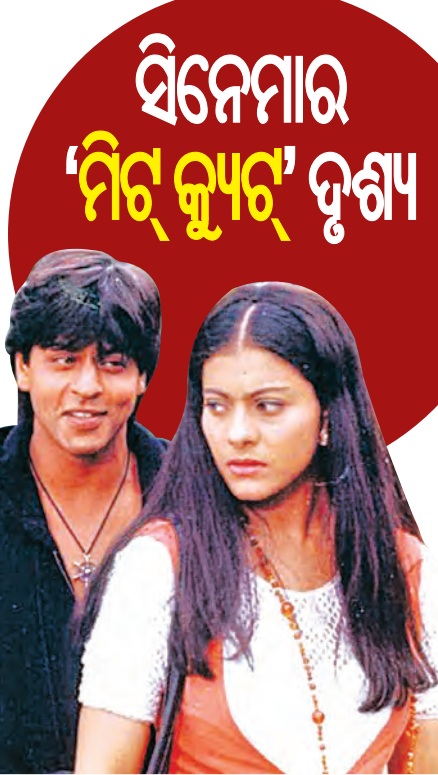
ସିନେମାର 'ମିର୍ କ୍ୟୁର୍' ଦୃଶ୍ୟ

କାଣିନିଅନ୍ତୁ ଓ କହନ୍ତୁ ସେହି ଅନୁସାରେ ଯଦି 'ମୟୂରୀ ଗୋ ତୁମ ଆକାଶେ ମୁଁ ଦିନେ' ଗୀତର ଗାୟନ ସଙ୍ଗଠନ ହୋଇଥାନ୍ତା, ତେବେ ଏହି ବିବାଦ ହୋଇଥାନ୍ତା କି? 'ମୟୂରୀ ଗୋ ତୁମ ଆକାଶେ ମୁଁ ଦିନେ' ଗୀତଟି ପ୍ରକୃତରେ ଯୁଗର ସ୍ଵର ପାଇଁ ରଚିତ ହୋଇଥିଲା । ଅର୍ଥାତ୍ ନାୟିକା ପାଇଁ ଧାଡ଼ିଟିଏ ଓ ନାୟକ ପାଇଁ ଧାଡ଼ିଟିଏ । ଗୀତ ସଂରଚନାକୁ ଲକ୍ଷ୍ୟ କରନ୍ତୁ: ନାୟକ: ମୟୂରୀ ଗୋ ତୁମ ଆକାଶେ ମୁଁ ଦିନେ ମଲ୍ଲୀରେ ମେଘ ସାଜିଲି ଏବଂ ନାୟିକା: ଚନ୍ଦ୍ରକା ତୋଳି ନାଚିଲି ତୁମେ ଇନ୍ଦ୍ରଧନୁ ମୁଁ ଆଜିଲି । ଏହି ଧାରାରେ ଯଦି ଉଭୟ ନାୟକ ଓ ନାୟିକାଙ୍କ ପାଇଁ ସଙ୍ଗୀତ ଗ୍ରହଣ ହୋଇଥାନ୍ତା, ତେବେ ରଚନାର ସ୍ଵରୂପକୁ ନେଇ ବିବାଦ ହୋଇ ନଥାନ୍ତା । ଯେଣୁକେବଳ ନାୟକଙ୍କ ସ୍ଵର ପାଇଁ ପୂର୍ବା ଗୀତର ସଙ୍ଗୀତ ଗ୍ରହଣ ହେଲା ରଚନାର ଆବେଦନ ମଧ୍ୟ ବଦଳିଗଲା ।