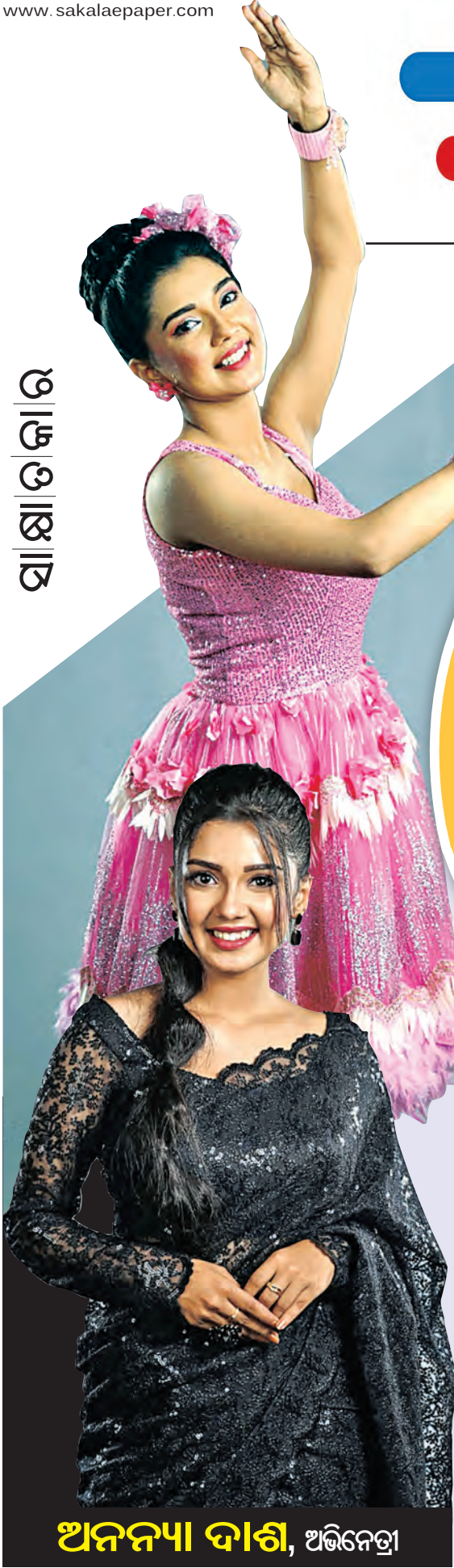
ଅନନ୍ୟା ଦାଶ, ଅଭିନେତ୍ରୀ