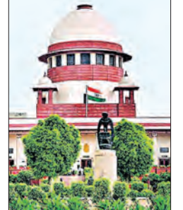
ପ୍ରାର୍ଥୀଙ୍କ ସମସ୍ତ ସ୍ଥାବର ସମ୍ପତ୍ତିର ସୂଚନା ଦେବା କୌଣସି ଆବଶ୍ୟକତା ନାହିଁ।

■ ନୂଆଦିଲ୍ଲୀ, ୯/୪ (ଏକେଡ଼ି): ନିର୍ବାଚନ କ୍ଷେତ୍ରରୁ ବାହାରିବା ପରେ ପ୍ରାର୍ଥୀ ସମସ୍ତ ସମ୍ପତ୍ତିର ସୂଚନା ଦେବା ଅନାବଶ୍ୟକ। ଅନ୍ତତଃ ମହତ୍ତ୍ୱ ନିର୍ବାଚନ ହୋଇଥିଲେ ନିର୍ବାଚନ ଲଢ଼ିଥିବା ପ୍ରାର୍ଥୀ କିମ୍ବା ତାଙ୍କ ପରିବାର ସଦସ୍ୟଙ୍କ ମାଲିକାନାରେ ଥିବା ସବୁ ସ୍ଥାବର ସମ୍ପତ୍ତିର ସୂଚନା ଦେବା କୌଣସି ଆବଶ୍ୟକତା ନାହିଁ। ନିର୍ବାଚନ ଲଢ଼ିଥିବା ପ୍ରାର୍ଥୀଙ୍କ ସମ୍ପତ୍ତିର ସୂଚନା ଦେବା କୌଣସି ଆବଶ୍ୟକତା ନାହିଁ। ଅଧିକାରୀଙ୍କ ପ୍ରଦେଶରେ ଉପାଧିକାରୀଙ୍କୁ ସୂଚନା ଦେବାକୁ ନିର୍ଦ୍ଦେଶ ଦିଆଯାଇଛି।