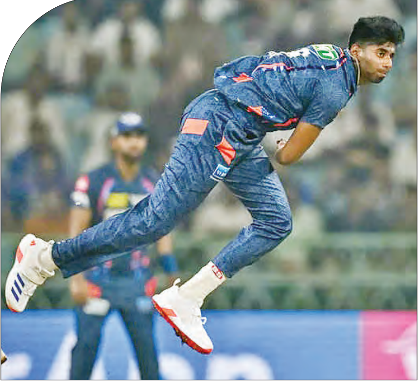
କୋଲ୍‌କାତା, ୩୧ (ଏକେଡ଼ି)

ଏତେ ବେଗରେ କେବେ ବୋଲିଂ କରି ନଥିଲେ । କିନ୍ତୁ ମୁମ୍ବାଇ ଟ୍ରାୟିଡ୍‌ରେ ସେ ୧୫୦ କିମି ବେଗରେ ବୋଲିଂ କରିଥିଲେ । ସବୁ ୨୪ଟି ଯାକ ବଲ୍‌କୁ ସେ ୧୫୦ କିମିରୁ ଉର୍ଦ୍ଧ୍ୱ ବେଗରେ ବୋଲିଂ କରିଥିଲେ । ପୂର୍ବରୁ ଅବଶ୍ୟ ସେ ନେଇଛନ୍ତି । ଏହି କୁବରୁ ତାରକା ଡିକେଟ୍‌କିପର ବ୍ୟାଟର ରକ୍ଷତ ପକ୍ଷ, ଶିଖର ଧାଞ୍ଜନ, ଆଶିଷ ନେହରାଙ୍କ ଭଳି କ୍ରିକେଟର ପ୍ରଶିକ୍ଷଣ ନେଇଛନ୍ତି । ସେ ବିନେ ଦ୍ରୁତତମ ବୋଲର ହେବ ବୋଲି ନେହରାଙ୍କ ପ୍ରଶଂସକ ପୂର୍ବାନୁମାନ କରି କହିଥିଲେ । ପଦାର୍ପଣ ମ୍ୟାଚ୍‌ରେ ସେ ଦ୍ରୁତବେଗରେ ବୋଲିଂ