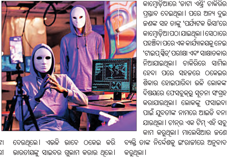
ଦେଉଥିଲେ। ଏଭଳି ଭାବେ ଠକେଇ କରି ଭାରତୀୟଙ୍କୁ ସାଇବର ଗୁଳାମି କରାଉ ଥିଲେ।

ଭାବେ ଫୋନ୍ ଖରି ଧମକ ଦେଉଥିଲେ। ଟଙ୍କା ମିଳିଗଲା ପରେ ଫୋନ୍ ସ୍ୱିଚ୍-ଅଫ୍ କରି ଯେ ମାମ୍ଲାକୁ ଭୁଲି ଜଣେ ଏକେନ୍ସି ତାଙ୍କୁ କାମ୍ବୋଡିଆରେ 'ଡାଟା ସ୍ୱିଚ୍' ଚାକିରିରେ ପ୍ରସ୍ତାବ ଦେଇଥିଲା। ପରେ ଅନ୍ୟ ଦୁଇ ଜଣଙ୍କ ସହ ତାଙ୍କୁ 'ପର୍ଯ୍ୟଟକ ଭିଆ'ରେ କାମ୍ବୋଡିଆ ପଠା ଯାଇଥିଲା। ସେଠାରେ ପହଞ୍ଚିବା ପରେ ଏକ କାର୍ଯ୍ୟକ୍ରମକୁ ନେଇ 'ଟାଇମ୍ ସ୍ୱିଚ୍' ପରୀକ୍ଷା ଏବଂ ସାକ୍ଷାତକାର ନିଆଯାଇଥିଲା। ଚାକିରିରେ ସାମିଲ ହେବା ପରେ ସହକର୍ମୀ ଠକେଇର ଶିକାର ହୋଇପାରିବା ଭଳି ଲୋକଙ୍କ ବିଷୟରେ ଫେସବୁକ୍‌ରୁ ସୂଚନା ଫଗ୍ରହ କରାଯାଇଥିଲା। ଲୋକଙ୍କୁ ପସାଇବା ପାଇଁ ଯୁବତୀଙ୍କ ନାମରେ ଆଇଡି ବନା ଯାଇଥିଲା। ଚାନ୍ଦି ଏକ ଟିଏ ଏହି ସବୁ ତାଙ୍କ ନିର୍ଦ୍ଦେଶକୁ ଲଢ଼ାକାତରେ ଅନୁସାରେ