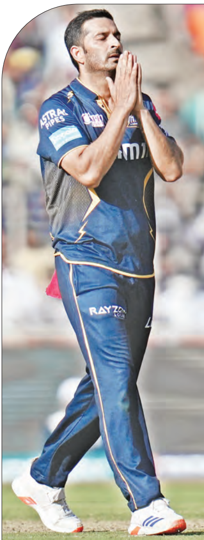
ଅହମ୍ମଦାବାଦ, ୩୧ (ଏକେଡ଼୍ି)

ଚଳିତ ଇଣ୍ଡିଆନ୍ ପ୍ରିମିୟର ଲିଗ୍ (ଆଇପିଏଲ୍)ର ୧୭ତମ ସଂସ୍କରଣରେ ଶୁଭମାନ ଚିଲକ ନେତୃତ୍ଵାଧୀନ ଗୁଜରାଟ ଟାଇଟନ୍ସ ଚଳିତ ମାସ ୧୭ତମ ପ୍ରତିଯୋଗିତାରେ ସୁକର୍ମାକାରରେ ସନରାଇଜର୍ସ ହାଇଦ୍ରାବାଦ ଦଳକୁ ପରାସ୍ତ କରିଛି। ୫ଟି ବଲ୍ ବାକିଥିବା ୬୯ ରନ୍ ହାତରେ ମୋହିତ୍ ଟାଇଟନ୍ସର ପ୍ରତିନିଧିତ୍ଵ କରିବାକୁ ପ୍ରସ୍ତୁତ ହେବେ।