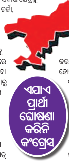
ଏସୀଏ ପ୍ରାର୍ଥୀ ଘୋଷଣା କରିନି କଂଗ୍ରେସ୍

ପୁରୀ, ୩୧।୩ (ସମ୍ବିଧ): ଉପକୂଳବର୍ତ୍ତୀ ଜିଲାର ଏକ ଚର୍ଚ୍ଚିତ ସଂସଦୀୟ କ୍ଷେତ୍ର ପୁରୀ। ଏଥର ମଧ୍ୟ ପୁରୀ ସଂସଦୀୟ କ୍ଷେତ୍ରକୁ ନେଇ ରାଜ୍ୟରୁ ଦିଲ୍ଲୀ ଯାତ୍ରାରେ ପହଞ୍ଚିବା ପାଇଁ ବଡ଼ ସଫଳତା ବୋଲି କୁହାଯାଏ। ତେବେ ପୂର୍ବରୁ ଏହି ଆସନକୁ କଂଗ୍ରେସ୍ ଆଧିକାରୀ ସମୟ ନିଜ କବ୍‌ଜାରେ ରଖିଥିଲେ। ହେଲେ ବିଜେଡିର ପ୍ରତିଷ୍ଠା ହେବା ପରେ ଏହି କ୍ଷେତ୍ର ଆଉ ଖାତା ଖୋଲିଯାଇ ନାହିଁ। ବିରୋଧୀ ଦଳ ଯେତେପ୍ରକାର ଉଦ୍ୟମ କରୁଥିଲେ ମଧ୍ୟ ସଫଳ ହେଉନାହାନ୍ତି। ୧୯୯୬ରେ ଶେଷଥର ପାଇଁ କଂଗ୍ରେସ୍ ଏଠାରେ ଜିତିଥିଲା। ପିନାକା ମିଶ୍ର ସେତେବେଳେ କଂଗ୍ରେସରୁ ଜିତିଥିଲେ। ପରବର୍ତ୍ତୀ ସମୟରେ ବିଜେଡିରେ ମିଶ୍ରିତ୍ଵ ପିନାକା ଏଠାରୁ ହାସଲ କରିଛନ୍ତି। ଅର୍ଥାତ୍ ୨୦୦୯, ୨୦୧୪ ଓ ୨୦୧୯ରେ ଏଠାରୁ ସଂସଦ ଭାବେ ନିର୍ବାଚିତ ହୋଇଛନ୍ତି। ହେଲେ ଏଥର ଦଳ ନୂଆପୂର୍ଣ୍ଣ ଭାବେ ଓଡ଼ିଶା ମୋ ପରିବାରର ରାଜ୍ୟ ଆବାହକ ଅରୁଣ ଚନ୍ଦ୍ର ମାଲିକଙ୍କୁ ପ୍ରୋତ୍ସାହଣ କରିଛି। ସେପଟେ ବିଜେପିରୁ ଗତଥର ପରାଜିତ ପ୍ରାର୍ଥୀ ସମ୍ବିଧ ପାତ୍ରଙ୍କୁ ଦଳ ପୁଣି ଭରସା କରିଥିବା ବେଳେ ଏ ପର୍ଯ୍ୟନ୍ତ କଂଗ୍ରେସ୍ ତା' ଚିତ୍ର ସ୍ୱଂସ୍ୱ କରିନି।