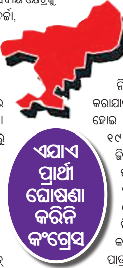
ଏସୀଏ ପ୍ରାର୍ଥୀ ଘୋଷଣା କରିବା କଂଗ୍ରେସ