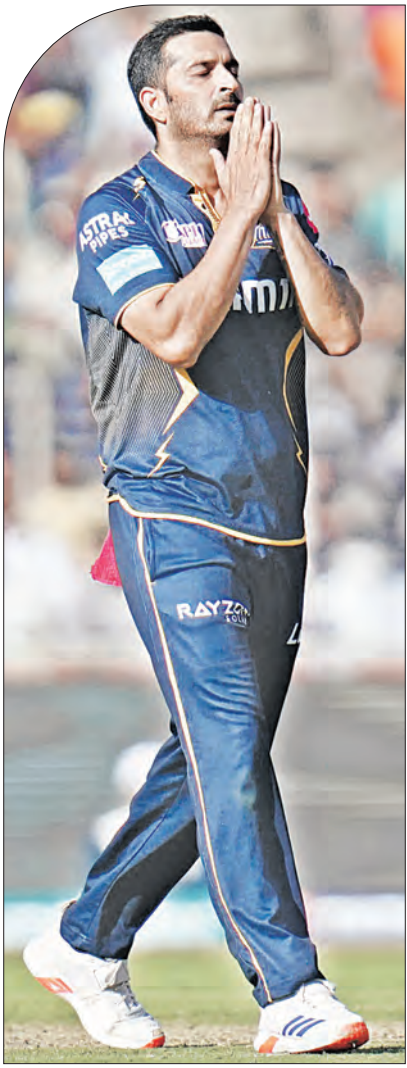
ଅହମ୍ମଦାବାଦ୍, ୩୧ (ଏକେଡ଼ି)

ସହ ଗୁଜରାଟ ଟାଇଟନ୍ସର ଦ୍ୱିତୀୟ ବିଜୟ ହାସଲ କରିଛି। ସ୍ଥାନୀୟ ନଗରୀୟ ମୋହିତ୍ ଷ୍ଟାଡ଼ିୟମରେ ହାଇଦ୍ରାବାଦ୍ ଟେମ୍ ଟିମ୍ ପ୍ରଥମେ ବ୍ୟାଟିଂ କରି ନିର୍ଦ୍ଧାରିତ ୨୦ ଓଭରରେ ୮ ଡିକେଟ୍ ହରାଇ ୧୨୨ ରନ ସଂଗ୍ରହ କରିଥିଲା। ଜବାବରେ ଗୁଜରାଟ ୧୯୧ ଓଭରରେ ୩ ଡିକେଟ୍ ହରାଇ ୧୬୮ ରନ କରିବାକୁ ସମର୍ଥନ ପାଇଥିଲା। ୪ ଓଭର ବୋଲିଂ କରି ୨୫ ରନ ଦେଇ ମୁଲ୍ୟବାନ ୩୧ ଡିକେଟ୍ ହାସଲ କରିଥିବା ଗୁଜରାଟ ଅଭିଜ୍ଞ ଦ୍ରୁତ ବୋଲର ମୋହିତ୍ ଶର୍ମା ମ୍ୟାଚ୍ରେ ଶ୍ରେଷ୍ଠ ଖେଳାଳି ବିବେଚିତ ହୋଇଛନ୍ତି। ଗୁଜରାଟ ଗାଟି ମ୍ୟାଚ୍ ଖେଳି ୨ ବିଜୟ ଓ ୧ ପରାଜୟ ସହ ୪ ଅକ୍ ହାସଲ କରି ଚାଲିକାର ଚତୁର୍ଥ ସ୍ଥାନରେ ରହିଛି। ଅନ୍ୟପକ୍ଷେ ହାଇଦ୍ରାବାଦ୍ ୩୧ ମ୍ୟାଚ୍ରେ ୧ ବିଜୟ, ୨ ପରାଜୟ ସହ ୨ ଅକ୍ ହାସଲ କରି ଚାଲିକାର ୫ମ ସ୍ଥାନରେ ରହିଛି। ୧୬୩ ରନ ଆଉଟରେ ଲକ୍ଷ୍ୟର ପିଛା କରିବାରେ ଗୁଜରାଟ ସମସ୍ୟାର ସମ୍ମୁଖୀନ ହୋଇ ନଥିଲା। ଦ୍ରୁତ ଓପନର ରିଜିମାନ ଶାହା ଓ ଶୁଭମାନ ପ୍ରଥମ ଡିକେଟ୍ରେ ୩୬ ରନ ସଂଗ୍ରହ କରିଥିଲେ। ୧୩ ବଲ୍ରେ ୧ ଟୋକା ଓ ୨ ଛକା ସହ ୨୫ ରନ କରିଥିବା ବେଳେ ରିଜିମାନ ଶାହାଙ୍କ ଅହମ୍ମଦଙ୍କ ବଲ୍ରେ ମିଡ୍ ଡିକେଟ୍ରେ ପ୍ୟାଟ୍ କୁମ୍ଭକର କ୍ୟାଚ୍ ଦେଇଥିଲେ। ଏହାପରେ ଗିଲ୍ ୩୬ ରନ (୨୮ ବଲ୍, ୨ ଟୋକା, ୧ ଛକା) କରି ମୟଙ୍କ ମାର୍କେଟ୍ ବଲ୍ରେ ଆଉଟ୍ ହୋଇଥିଲେ। ସାଲ୍ ସୁବର୍ଣ୍ଣନ ୩୬ ବଲ୍ରେ ସମ୍ମୁଖୀନ ହୋଇ ୪ ଟୋକା ଓ ୧ ଛକା ସହ ୪୫ ରନ କରିଥିବା ବେଳେ କୁମ୍ଭକର ବଲ୍ରେ ତିପୁ ମିଡ୍ ଡିକେଟ୍ରେ ଅଭିଷେକ ଶର୍ମାଙ୍କୁ କ୍ୟାଚ୍ ଦେଇ ପ୍ୟାରିଲିୟମ୍ ଫେରିଥିଲେ। ଏହାପରେ ଡେଭିଡ୍ ମିଲର ୪୪ ରନ (୨୭ ବଲ୍, ୪ ଟୋକା, ୨ ଛକା) ଓ