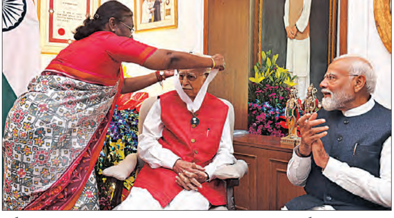
ପୂର୍ବରୁ ଘୋଷଣା କରାଯାଇଥିଲା, କିନ୍ତୁ ସ୍ୱାସ୍ଥ୍ୟଗତ କାରଣରୁ ସେ ରାଷ୍ଟ୍ରପତି ଭବନ ଯାଇପାରିନଥିଲେ। ତେଣୁ ଆଜି ରାଷ୍ଟ୍ରପତି ମୁର୍ମୁ ତାଙ୍କ ବାସଭବନକୁ ଯାଇ ତାଙ୍କୁ ଏହି ସମ୍ମାନ ପ୍ରଦାନ କରିଛନ୍ତି।

ନୂଆଦିଲ୍ଲୀ, ୩୧ ମାର୍ଚ୍ଚ (ଏକେନିଉ) - ରାଷ୍ଟ୍ରପତି ଦ୍ରୌପଦୀ ମୁର୍ମୁ ଆଜି ବିଜେପିର ବୟୋଡ଼୍ଡ଼ ନେତା ଲାଲକୃଷ୍ଣ ଆତତ୍ୟାଗୀଙ୍କୁ ଦିଲ୍ଲୀ ବାସଭବନରେ ପହଞ୍ଚି ପ୍ରଧାନମନ୍ତ୍ରୀ ନରେନ୍ଦ୍ର ମୋଦୀ, ଉପରାଷ୍ଟ୍ରପତି ଜଗନ୍ନାଥ ଧନଶର ଓ ପୂର୍ବତନ ଉପରାଷ୍ଟ୍ରପତି ଏମ ଭେଙ୍କେୟା ନାଲଡୁଙ୍କ ଉପସ୍ଥିତିରେ ତାଙ୍କୁ ଦେଶର ସର୍ବୋଚ୍ଚ ବ୍ୟୋମବିକ ସମ୍ମାନ 'ଭାରତ ରତ୍ନ' ପ୍ରଦାନ କରିଛନ୍ତି। ଗତକାଲି ରାଷ୍ଟ୍ରପତି ଭବନରେ ଆୟୋଜିତ ଏକ ସମାବେଶରେ ରାଷ୍ଟ୍ରପତି ମୁର୍ମୁ ଦୁଇ ପୂର୍ବତନ ପ୍ରଧାନମନ୍ତ୍ରୀ ଚୌଧୁରୀ ଚରଣ ସିଂହ ଓ ପି.ଭି.ନରସିଂହ ରାଓ, ପୂର୍ବତନ ମୁଖ୍ୟମନ୍ତ୍ରୀ କାର୍ଯ୍ୟକ୍ରମ ଠାକୁର ଓ କୃଷି ବିଜ୍ଞାନୀ ଏଏସ୍ ସ୍ୱାମୀନାଥନଙ୍କୁ ମନୋରଞ୍ଜନ ଭାବେ ଭାରତ ରତ୍ନ ସମ୍ମାନ ପ୍ରଦାନ କରିଥିଲେ। ଲାଲକୃଷ୍ଣ ଆତତ୍ୟାଗୀଙ୍କୁ ମଧ୍ୟ ଭାରତ ରତ୍ନ ସମ୍ମାନ ମିଳିବ ବୋଲି କେହି କହିଛନ୍ତି।