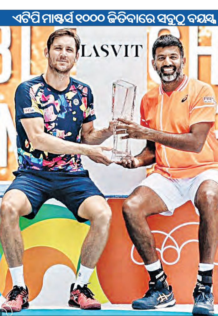
ଏଟିପି ମାଷ୍ଟର୍ସ ୧୦୦୦ ଜିତିବାରେ ସବୁଠୁ ବୟସ୍କ ଖେଳାଳିକୁ ପୁରସ୍କାର କରିବାକୁ ସେ କହିଛନ୍ତି। ୪୪ ବର୍ଷ ବୟସରେ ସେପାଦାର ଟେନିସରେ ଏଭଳି ସଫଳତା ହାସଲ କରିବା ନିଶ୍ଚିତ ଭାବେ ଏକ ବଡ଼ କଥା। ବୋପାନ୍ନା ତାଙ୍କ ଦୁଇ ବୟସ୍କ ଉର୍ଦ୍ଧ୍ୱ କ୍ୟାରିୟରରେ ଥରେ ପୁରୁଷ ମୁଗଲରେ ଗ୍ରାଣ୍ଡସ୍ଲାମ

ମିଆମି, ୩୧ ଅକ୍ଟୋବର (ଏକେଡି): ଏଠାରେ ଚାଲିଥିବା ମିଆମି ଓପନ୍ ଟେନିସ୍ ଟୁର୍ଣ୍ଣାମେଣ୍ଟରେ ଭାରତୀୟ ଅଭିଜିତ ଗୋହନ ବୋପାନ୍ନା ପୁରୁଷ ମୁଗଲ ପ୍ରତିଯୋଗିତାରେ ଟାଇଟଲ ଜିତି ଇତିହାସ ସୃଷ୍ଟି କରିଛନ୍ତି। ପାଇନାଲ ମ୍ୟାଚ୍‌ରେ ଶ୍ରେଷ୍ଠ ସିଡ୍ ମାନ୍ୟତା ପାଇଥିବା ୪୪ ବର୍ଷୀୟ ବୋପାନ୍ନା ଓ ତାଙ୍କ ଅଷ୍ଟ୍ରେଲିଆ ସାଥୀ ମାଧୁସୂଦ ୨-୬, ୬-୨, ୩-୧, ୧-୬ ସେଟ୍‌ରେ ଦ୍ୱିତୀୟ ସିଡ୍ କ୍ଲୋଏସିଆର ଲଭାନ ଡୋଲିଂ ଓ ଆମେରିକାର ଅଷ୍ଟିନ କ୍ୱାଲିଫେକ୍ସକୁ ପରାସ୍ତ କରି ଚାମ୍ପିଅନ ହୋଇଛନ୍ତି। ଏଥିସହ ବୟୋଜ୍ୟୋଷ୍ଠ ଖେଳାଳି ଭାବେ ସେ ଏଟିପି ମାଷ୍ଟର୍ସ ୧୦୦୦ ଟାଇଟଲ ଜିତି ଇତିହାସ ସୃଷ୍ଟି କରିଛନ୍ତି। ଏହି କ୍ରମରେ ଗତବର୍ଷ ସେ ଇଣ୍ଡିଆନ୍ ଷ୍ଟେଲରେ ହାସଲ କରିଥିବା ରେକର୍ଡକୁ ପଛରେ ପକାଇଛନ୍ତି। ଏହି ବିଜୟ ସହ ସେ ଏଟିପି ମୁଗଲ ମାନ୍ୟତାର ଶୀର୍ଷ ସ୍ଥାନକୁ ଚଢ଼େଇଛନ୍ତି।