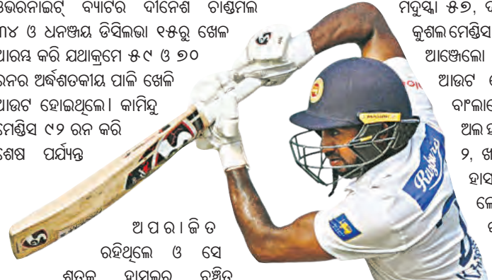
ଅପରାଜିତ ରହିଥିଲେ ଓ ସେ ଶତକ ହାସଲରୁ ବଞ୍ଚିତ

ହୋଇଥିଲେ। ଅନ୍ୟମାନଙ୍କ ମଧ୍ୟରେ ପ୍ରବାସି ଜୟସୁରିୟା ୨୮, ବିଶ୍ୱ ପର୍ଣ୍ଣାଟୋ ୧୧, ଲାହିରୁ କୁମାର ୧୧ ରନ କରି ଆଉଟ୍ ହୋଇଥିବା ବେଳେ ଅସିଆ ପର୍ଣ୍ଣାଟୋ ଖାତା ଖୋଲିପାରି ନଥିଲେ। ପୂର୍ବରୁ ଓପନର ନିଶାନ ମହମ୍ମା ୫୬, ଦିପ୍ତି କରୁଣାରତ୍ନ ୮୬, କୁଶଳ ମେଣ୍ଟିସ ୯୩, ଅଭିଜିତ ଅଲରାଉଣ୍ଡର ଆଖେଲୋ ମାଧୁସୂଦ ୨୩ ରନ କରି ଆଉଟ୍ ହୋଇଥିଲେ। ବୋଲିଂରେ ବାଲିଦେଶ ତରଫରୁ ସାକିବ ଅଲ ହାସନ ୩, ହାସନ ମାହମୁଦ ୨, ଖଲିଲ ଅହମ୍ମଦ ଓ ମୋହିଦ୍ ହାସନ ମିରାଜ ଗୋଟିଏ ଲେଖାଏ ଡିକେଟ୍ ଅଜ୍ଞିଆର କରିଥିଲେ। ଶ୍ରୀଲଙ୍କାର ୩ ବ୍ୟାଟର ରନ ଆଉଟ୍ ହୋଇଥିଲେ।