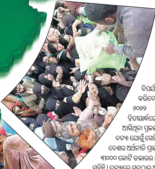
ବିପର୍ଯ୍ୟୟ କରିଦେଇଛି ।