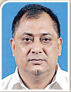
ଭାଗ୍ୟ ତଜାରେ କଣା