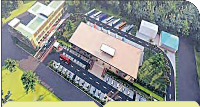
ଜିଲ୍ଲା ସଦର ମହକୁମାରେ ହେବ ଅତ୍ୟାଧୁନିକ ବସ୍‌ଷ୍ଟାଣ୍ଡ