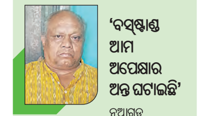
‘ବସ୍ଷାଣ୍ଡ ଆମ ଅପେକ୍ଷାର ଅନ୍ତ ଘଟାଇଛି’

ନୂଆଗଡ଼ ପରି ପଛୁଆ ଅଞ୍ଚଳରେ ଆଧୁନିକ ଶୈଳୀର ବସ୍ଷାଣ୍ଡ ନିର୍ମାଣ ଆମେ କେବେ ବି ଭାବି ନ ଥିଲୁ । ହେଲେ ରାଜ୍ୟ ସରକାରଙ୍କ ଯୁଗାନ୍ତକାରୀ ପଦକ୍ଷେପ ଯୋଗୁଁ ପଛୁଆ ଅଞ୍ଚଳରେ ମଧ୍ୟ ଝଲସୁଛି ନବନିର୍ମିତ ବସ୍ଷାଣ୍ଡ । ପୂର୍ବରୁ ଯାତ୍ରାମାନେ ଘଣ୍ଟା ଘଣ୍ଟା ଧରି ରାସ୍ତା କଡ଼ରେ ଅପେକ୍ଷା କରୁଥିଲେ ଯାତ୍ରାବାହୀ ଗାଡ଼ି ପାଇଁ । ହେଲେ ଏବେ ବସ୍ଷାଣ୍ଡଟିଏ ନିର୍ମାଣ ହୋଇଥିବାରୁ ସବୁ ଅପେକ୍ଷାର ଅନ୍ତ ଘଟିଛି । ବିଶ୍ରାମଗାରଠାରୁ ଆରମ୍ଭ କରି ଶୈଳୀଲକ୍ଷଣ, ଗାଡ଼ିଏ ଆଦି ରହିଛି । ଯାହାକି ବସ୍ଷାଣ୍ଡଟି ଅତି ଆକର୍ଷଣୀୟ ଦେଖା ଦେଉଛି ।