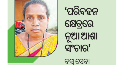
‘ପରିବହନ କ୍ଷେତ୍ରରେ ନୂଆ ଆଶା ସଂଚାର’

ବସ୍ ସେବା ଦ୍ୱାରା ନୂଆଗଡ଼ ବାସିନ୍ଦାଙ୍କୁ ସ୍ଥାନୀୟ ବେପାରରେ ସୁବିଧା ହୋଇପାରିଛି । ମୁଖ୍ୟତଃ ଛାତ୍ରଛାତ୍ରୀମାନେ ପାଠପଢ଼ା ନିମନ୍ତେ ସ୍କୁଲ ଟଙ୍କାରେ ଯାତାୟତ କରି ପାରୁଛନ୍ତି । ମହିଳାମାନଙ୍କୁ ବି ସୁବିଧା ମିଳିଛି । ପଞ୍ଚାୟତଠାରୁ ବ୍ଲକ୍ ଓ ଜିଲ୍ଲା ପରିବହନ କ୍ଷେତ୍ରରେ ଏହା ନୂଆ ଆଶା ସଂଚାର କରିଛି ।