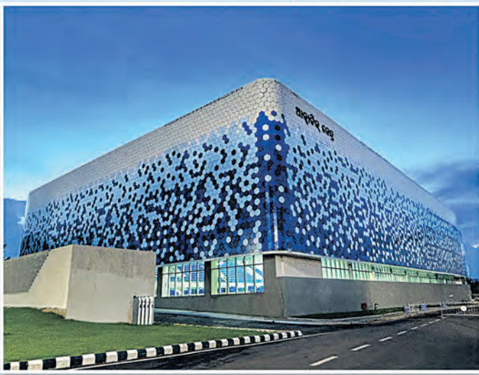
ଇନ୍ଡୋର୍ ଡାଇଭିଂ ସେଣ୍ଟରର ଭିଡିଓସ୍ତର ସ୍ଥାପନ