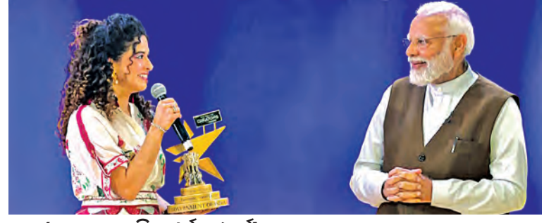
'ନ୍ୟାସନାଲ କ୍ରିଏଟିଭ ଆର୍ଖାଇଭ' ପ୍ରଦାନ କଲେ ପ୍ରଧାନମନ୍ତ୍ରୀ ମୋଦୀ