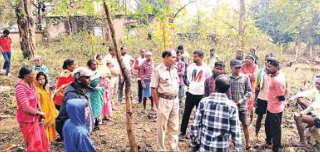
କର୍ମୀ ରହିଛି। ଏଠାରେ ପୂର୍ବ ପୁରୁଷରୁ ପୋଲ ନିର୍ମାଣ କରାଯିବ ବୋଲି କହିଛନ୍ତି। ଏହା ପକ୍ଷରୁ ଉନ୍ନୟନ ବିଭାଗର କର୍ମୀଙ୍କୁ ନିର୍ମାଣ କାର୍ଯ୍ୟକ୍ରମ ପାଇଁ ଯୋଗାଣ କରାଯାଇଥିଲା।

ଯୋଡ଼ା ବ୍ଲକ୍ ବିରିକଳା ରାସ୍ତାର ସୁନାମଦା ଉପରେ ପୋଲ ନିର୍ମାଣକୁ ସ୍ଥାନୀୟ ଆଦିବାସୀ ବିରୋଧ କରିଛନ୍ତି। ମୁହଁଦାକୁ ଲହଣୀ ଯିବା ପାଇଁ ପ୍ରସ୍ତାବିତ ପୋଲ ନିର୍ମାଣ ନିମନ୍ତେ ଗ୍ରାମୀଣ ଉନ୍ନୟନ ବିଭାଗ ପକ୍ଷରୁ ଗୁରୁବାର ଅପରାହ୍ନରେ ଏହାର ଶୁଭ ଦେବଦାର କାର୍ଯ୍ୟକ୍ରମ ରହିଥିଲା। ସୂଚନା ଅନୁଯାୟୀ, ସୁନା ନଦୀ ଉପରେ ଏକ ପୋଲ ନିର୍ମାଣ ପାଇଁ ଚଳୁଥିବା ବିଧିବିଧାନ ମାଧ୍ୟମରେ ଏହାକୁ ଗୁରୁବାର ଉନ୍ନୟନ ବିଭାଗର କର୍ମୀଙ୍କୁ ନିର୍ମାଣ କାର୍ଯ୍ୟକ୍ରମ ପାଇଁ ଯୋଗାଣ କରାଯାଇଥିଲା।