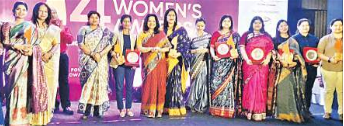
ଅନ୍ତର୍ଜାତୀୟ ମହିଳା ଦିବସ ଅବସରରେ ପୂର୍ବରୁ ଭୁବନେଶ୍ୱରରେ ଫିଲ୍ ପକ୍ଷରୁ କ୍ରୀଡ଼ାବିତ୍ ଶ୍ରଦ୍ଧାଞ୍ଜଳି ସାମଗ୍ରୀର ଉଦ୍ଘାଟନା କରୁଥିବା ମହିଳା କ୍ରୀଡ଼ାବିତ୍ ମୁଖ୍ୟ ଅତିଥି ତଥା ଉତ୍ତମ କମିସନର ଅନୁ ଗର୍ଗ ଗୁରୁବାର ସମ୍ବର୍ଦ୍ଧିତ କରୁଛନ୍ତି ।

ମିଶିପୁର ଜନ୍ମାଳରେ ଜନ୍ମିତ ୪୩ ବର୍ଷୀୟା ଓଇନାମ ବେମବେମ୍ ଦେବୀ 'ଭାରତୀୟ ମହିଳା ପୁରୁବଳର ଦୁର୍ଗ' ଭାବେ ପରିଚିତ । ଦେଶର ପ୍ରଥମ ମହିଳା ପୁରୁବଳ ଖେଳାଳି ଭାବେ ସେ ସମ୍ମାନଜନକ 'ପଦ୍ମଶ୍ରୀ' ପୁରସ୍କାର ପାଇଥିଲେ । ୨୦୧୦ ଓ ୨୦୧୬ରେ ସାଉଥ୍ ଏସିଆନ୍ ପୁରୁବଳରେ ସର୍ବମ୍ମ ପଦକ ଜିତିଥିବା ଭାରତୀୟ ଦଳର ସେ ପ୍ରମୁଖ