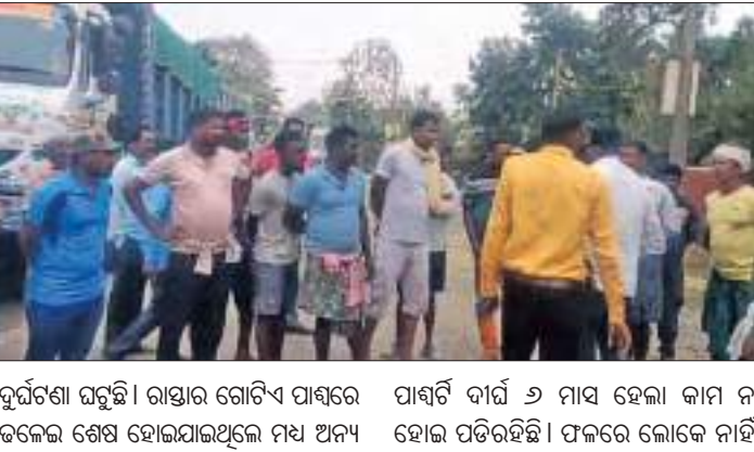
ପୂର୍ବଦ୍ୱାରା ୧୧୯୩୭ ଅପରାଧ ନୀତି ପର୍ଯ୍ୟନ୍ତ ୫ ଘଣ୍ଟା ଧରି ଉପକା-ବାଲେଶ୍ୱର ରାଷ୍ଟ୍ରାର ସାହିକୂଳାଠାରେ ଅଞ୍ଚଳବାସୀ ରାଷ୍ଟ୍ରାରୋକ କରିଥିଲେ ।

କୁଆମରା, ୨୩ (ସମିତ): ନିମ୍ନମାନର ରାଷ୍ଟ୍ରା କାମ ଏବଂ ମନ୍ତ୍ରୀ ଗଣତନ୍ତ୍ରରେ ଚାଲିଥିବା ପ୍ରତିବାଦ କଣ୍ଠାଗୁଡ଼ିକର ପୂର୍ବଦ୍ୱାରା ୧୧୯୩୭ ଅପରାଧ ନୀତି ପର୍ଯ୍ୟନ୍ତ ୫ ଘଣ୍ଟା ଧରି ଉପକା-ବାଲେଶ୍ୱର ରାଷ୍ଟ୍ରାର ସାହିକୂଳାଠାରେ ଅଞ୍ଚଳବାସୀ ରାଷ୍ଟ୍ରାରୋକ କରିଥିଲେ । ପଞ୍ଚପଲ୍ଲୀ କଲେଜଠାରୁ ପୂର୍ବକୁ ପ୍ରାୟ ୧ କିମି ରାଷ୍ଟ୍ରା ଫୁଲୁ ଠିକାଦାର ଗଡ଼ ସେପ୍ଟେମ୍ବର ମାସରେ କାର୍ଯ୍ୟ ଆରମ୍ଭ କରିଥିଲେ; ହେଲେ ଅନ୍ୟାନ୍ୟ କାମ ଫୁଲୁ ନକରି ଅଧାଗଠା ଅବସ୍ଥାରେ ପକାଇ ରଖିଥିବାରୁ ବିଭିନ୍ନ ସମୟରେ