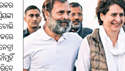
ବିପକ୍ଷରେ ପ୍ରତିଦ୍ଵନ୍ଦ୍ଵିତା କରିବେ ବୋଲି ଜଣାପଡ଼ିଛି । ଉଲ୍ଲେଖଯୋଗ୍ୟ ଯେ, ରାହୁଲ ୨୦୦୪ରେ ଆମେଥିରୁ ନିଜର ରାଜନୈତିକ କ୍ୟାରିୟର ଆରମ୍ଭ କରିଥିଲେ । ଏହି ସମୟରେ ସେ ବିପ୍ଲବ ଭୋଟରେ ବିଜୟ ହୋଇଥିଲେ । କିନ୍ତୁ ୨୦୧୯ ନିର୍ବାଚନରେ ସେ ସୁଜିତା ନାୟକଙ୍କୁ ଠାରୁ ହାରି ଯାଇଥିଲେ । କଂଗ୍ରେସ ୨୦୨୪ ନିର୍ବାଚନରେ ବିଜେପିକୁ ଟକ୍କର ଦେବା ଲାଗି ନିର୍ବାଚନୀ ଘୋଷଣାପତ୍ର ପ୍ରସ୍ତୁତ କରିସାରିଛି । ମିଳିଥିବା ସୂଚନା ଅନୁସାରେ କେନ୍ଦ୍ରରେ ଖାଲି ପଡ଼ିଥିବା ୩୦ ଲକ୍ଷ ନିୟୁତ ସହ ଟାକ୍ସା ଏମ୍‌ସିଏମ୍ ଟ୍ୟାଲେଣ୍ଟ ଏବଂ ଜାତିଭିତ୍ତିକ ଜନଗଣଙ୍କୁ ଦଳ ଗୁରୁତ୍ଵ ଦେଇଛି । ଏହା ବ୍ୟତୀତ କେନ୍ଦ୍ରରେ ୩୦ ପ୍ରତିଶତ ମହିଳାଙ୍କୁ ସଂରକ୍ଷଣ ଏବଂ ମାସିକ ୬ ହଜାର ଟଙ୍କା ଦେବାକୁ ମଧ୍ୟ ଦଳ ନିଜ ଘୋଷଣାପତ୍ରରେ ପ୍ରତିଶ୍ରୁତି ଦେଇଥିବା କୁହାଯାଇଛି । ତେବେ ସିଡ଼ିକ୍ୟୁଟି ଅନୁମୋଦନ ପରେ କଂଗ୍ରେସ ଖୁବଶୀଘ୍ର ନିଜର ଘୋଷଣାପତ୍ର ଜାରି କରିବ ବୋଲି କୁହାଯାଇଛି ।

ନୂଆଦିଲ୍ଲୀ, ୨୩ (ଏକେନ୍ଦ୍ରି): କଂଗ୍ରେସ ନେତା ରାହୁଲ ଗାନ୍ଧୀ ଉତ୍ତରପ୍ରଦେଶର ଆମେଥି ଓ କେରଳର ଖାୟାତରୁ ଲୋକସଭା ନିର୍ବାଚନ ଲଢ଼ିବେ । ପ୍ରିୟଙ୍କା ଗାନ୍ଧୀ ରାୟବରେଲିରୁ ନିର୍ବାଚନ ଲଢ଼ିବେ ବୋଲି ଏକ ବିଶେଷ ରିପୋର୍ଟ ସୂଚନା ଜଣାପଡ଼ିଛି । ପକ୍ଷରେ ଏଥର ଆମେଥିରେ ରାହୁଲ ଏବଂ ବିଜେପି ନେତ୍ରୀ ସୁଜିତା ନାୟକ ନିର୍ବାଚନ ଲଢ଼େଇରେ ପୁଣି ମୁହାଁମୁହିଁ ହେବେ । ଆମେଥିରୁ ସୁଜିତା ପ୍ରତିଦ୍ଵନ୍ଦ୍ଵିତା କରିବେ ବୋଲି ପୂର୍ବରୁ ବିଜେପି ଘୋଷଣା କରିସାରିଛି । କିନ୍ତୁ କଂଗ୍ରେସ ଏହି ନିର୍ବାଚନ ମଣ୍ଡଳରେ କାହାକୁ ଛିଡ଼ା କରିବ ତାହା ସ୍ପଷ୍ଟ କରି ନଥିଲା । ଯାହାକୁ ନେଇ ସୁଜିତା ନାୟକ ବାରମ୍ବାର କଂଗ୍ରେସକୁ କଟାକ୍ଷ କରିଥିଲେ । ତେବେ ରିପୋର୍ଟ ଅନୁସାରେ ରାହୁଲ ହିଁ ସୁଜିତା