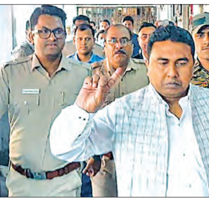
ପଶ୍ଚିମବଙ୍ଗ ସରକାରଙ୍କ ଆବେଦନର ଦ୍ଵାରକ ଶୁଣାଣିକୁ ସୁପ୍ରିମକୋର୍ଟଙ୍କ ନା

ପରାସ୍ତା ହେବା ପୂର୍ବରୁ ୪ଟା ପୂର୍ଣ୍ଣ ଶାହାଜାହାନଙ୍କୁ ସିବିଆଇ ହାତରେ ଦେବାକୁ କଡ଼ା ନିର୍ଦ୍ଦେଶ ଦିଆଯାଇଥିଲା । ସେପଟେ ହାଇକୋର୍ଟଙ୍କୁ ଟ୍ୟାଲେଣ୍ଟ କରି ରାଜ୍ୟ ସରକାର ସୁପ୍ରିମକୋର୍ଟରେ ପହଞ୍ଚିଥିଲେ ହେଁ ଏହି ପ୍ରସଙ୍ଗରେ ଉଭୟ ଶୁଣାଣି କରିବାକୁ ସର୍ବୋଚ୍ଚ ନ୍ୟାୟାଳୟ ମନା କରିଦେଇଥିଲେ । ଯାହାକୁ ନେଇ ରାଜ୍ୟ ସରକାରଙ୍କ ଅଧିକ ଗୁଡ଼ମ୍ ହୋଇଯାଇଥିଲା । ଶାହାଜାହାନଙ୍କୁ ସିବିଆଇ ହାତରେ ନ୍ୟସ୍ତ କରିବା ଛଡ଼ା ଅନ୍ୟ ପଦ୍ଧତି ଅନୁସାରେ ବୁଧବାର ସନ୍ଧ୍ୟା ପ୍ରାୟ ୬ ଘଣ୍ଟା ମିନିଟ୍ରେ ତାଙ୍କୁ ସିବିଆଇ ଅଧିକାରୀମାନଙ୍କୁ ହସ୍ତାନ୍ତର କରାଯାଇଛି । ଶାହାଜାହାନଙ୍କୁ ନିଜ ହେପାଜତକୁ ନେବା ପରେ ସିବିଆଇ ତାହାର ସ୍ଵାସ୍ଥ୍ୟ