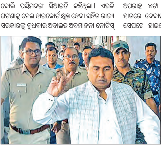
ପଶ୍ଚିମବଙ୍ଗ ସରକାରଙ୍କ ଆବେଦନର ଦ୍ଵିତୀୟ ଶୁଣାଣିକୁ ସୁପ୍ରିମକୋର୍ଟଙ୍କ ନା

ପଶ୍ଚିମବଙ୍ଗର ବହୁ ଚର୍ଚ୍ଚିତ ସନ୍ଦେଶଖାନି ଘଟଣା ବୁଧବାର ସନ୍ଧ୍ୟାରେ ନୂଆ ମୋଡ଼ ନେଇଛି।