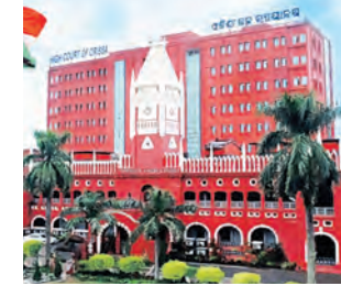
ବିଜ୍ଞପ୍ତିକୁ ମଧ୍ୟ ହାଇକୋର୍ଟରେ ଉପସ୍ଥାପନ କରାଯାଇଥିଲା।