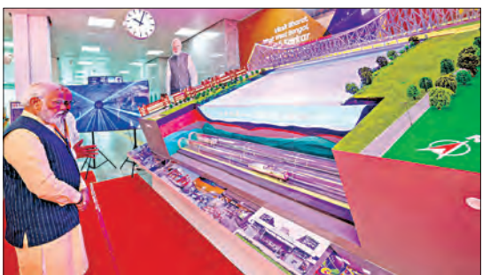
ଭାରତ ବିଶ୍ୱର ପାଣିତଳ ମେଟ୍ରୋ ୪୫ ସେକେଣ୍ଡରେ ସମ୍ପୂର୍ଣ୍ଣ ହେବ ୫୨୦ ମିଟର ଯାତ୍ରା କମ୍ପାନୀ କର୍ମଚାରୀଙ୍କ ଟିଆକ ନାମରେ ରଖାଯାଇଛି ଦେଶି ମେଟ୍ରୋ

■ କୋଲକାତା, ୬ମାର୍ଚ୍ଚ (ସଂକ୍ଷେପ): ପ୍ରଧାନମନ୍ତ୍ରୀ ନରେନ୍ଦ୍ର ମୋଦୀ ରୁଧିରୀର କୋଲକାତାରେ ଦେଶର ପ୍ରଥମ ଅଣ୍ଡରଗ୍ରାଉଣ୍ଡ (ପାଣି ତଳେ ଚାଲୁଥିବା) ମେଟ୍ରୋର ଉଦ୍ଘାଟନ କରିଛନ୍ତି। ଏହି ମେଟ୍ରୋ ଭୁବନେଶ୍ୱରୁ ୩୩ ମିଟର ତଳେ ରହିଛି। ହୁଗଳୀ ନଦୀ ପୁଷ୍ଟରୁ ୧୩ ମିଟର ତଳେ ଏହି ରେଳଧାରଣା ନିର୍ମାଣ କରାଯାଇଛି। ୧୯୮୪ରେ ଦେଶର ପ୍ରଥମ ମେଟ୍ରୋ ଟ୍ରେନ୍ କୋଲକାତାରେ ଆରମ୍ଭ ହୋଇଥିଲା। ଏହା ଉତ୍ତର କୋଲକାତା-ଦକ୍ଷିଣ କରିଡ଼ର (ରୁ ଲାଇନ) ମଧ୍ୟରେ ବୌଦ୍ଧି ଥିଲା। ▶ ପୃଷ୍ଠା-୧୩