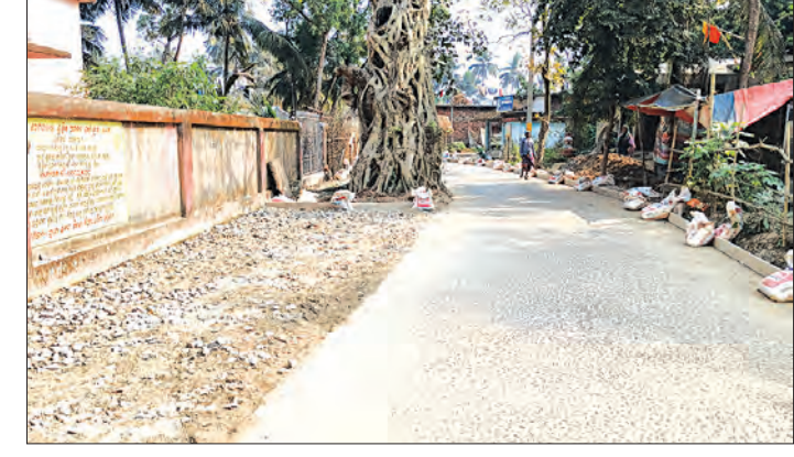
ମାନଙ୍କ ପାଇଁ ବିପଦ ସୃଷ୍ଟି କରିଛି। ଭୋଗରାଜ ହାଟ ପୂର୍ବ ବିଭାଗ ରାସ୍ତାର ପ୍ରକାଶ ଯେ, ଦେହୁଆଁ ଥାନା ଛକ ଠାରୁ ଜଳେଶ୍ୱରପୁର ଚଟାଣ ଛକ ଠାରୁ ଏହି ରାସ୍ତା

ବିଜ୍ଞାନ ଯୁଗରେ ବି ସମାଜର ଅଧିକାଂଶ ଭାଗ ପାଇ ନାହିଁ। ଖୋଟ ସରକାରଙ୍କ ଗ୍ରାମ୍ୟ ଉନ୍ନୟନ ବିଭାଗର ଯତ୍ନମାନଙ୍କୁ ମଧ୍ୟ ଏଥିରେ କବଳିତ ହୋଇଛନ୍ତି।