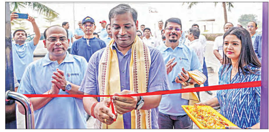
ବିଭାଗ ଆରମ୍ଭ ହୋଇଛି । ଏଠାରେ ଯୋଗ କାର୍ଯ୍ୟକ୍ରମର ଆରମ୍ଭ କରାଯାଇଛି । ସେହିପରି ଏକ ଏଡିଏମ୍ ମଧ୍ୟ ଉପସାହିତ ହୋଇଛି ।

କ୍ରୀଡ଼ା ଓ ଯୁବସେବା ବିଭାଗ ପକ୍ଷରୁ ପ୍ରବାଦ ପୁରୁଷ ବିଜୁ ପଟ୍ଟନାୟକଙ୍କ ଜୟନ୍ତୀ କଳିଙ୍ଗ ଷ୍ଟାଡିୟମରେ ମଙ୍ଗଳବାର ପାଳନ କରାଯାଇଛି ।