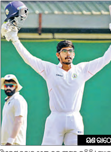
୯୩ ରନରେ ବିଦର୍ଭ ବିଜୟ ହୋଇଛି । ଏହି ଖବରରେ ବିଦର୍ଭ ବିଜୟର ମଧ୍ୟପ୍ରଦେଶ ଟ୍ୱିଟ୍ ଫୋର୍ମେଟରେ ଶ୍ରଦ୍ଧାଜ୍ଞା ପଢାଉଛି ।

ସ୍ଥାନୀୟ ବିଦର୍ଭ କ୍ରିକେଟ୍ ଆସୋସିଏସନ୍ ଗ୍ରାଉଣ୍ଡରେ ବିଦର୍ଭ ଓ ମଧ୍ୟପ୍ରଦେଶ ମଧ୍ୟରେ ଚାଲିଥିବା ରଣଜୀ ଟ୍ୱିଟ୍ ପ୍ରଥମ ସେନିପାଇନାଲ ମ୍ୟାଚ୍ ରୋମାଞ୍ଚକ ମୋଡ୍ରେ ପହଞ୍ଚିଛି ।