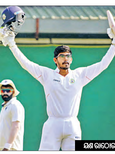
ଓଡ଼ିଶା ହରାଇ ୨୨୮ ରନ ହାତୀ ହେଉଛି । ମ୍ୟାଚ୍ ଆଉ ଗୋଟିଏ ଦିନ ବାକିଥିବା ବେଳେ ୪ ଟେଷ୍ଟ ବାକି ରଖି ମଧ୍ୟପ୍ରଦେଶ ବିଜୟ ପାଇଁ ଆଉ ୯୩ ରନ ଆବଶ୍ୟକ କରୁଛି । ଷ୍ଟମ୍ ଅପସାରଣ ବେଳକୁ ସାମାନ୍ୟ ଜୈନ ୧୬

ଜବାବରେ ବିପତ୍ତୀ ପାଇଁ ଆରମ୍ଭ କରି ମଧ୍ୟପ୍ରଦେଶ ଚତୁର୍ଥ ଦିବସ ଖେଳ ଶେଷ ସୁଦ୍ଧା ୭୧ ଓଭରରେ ୬