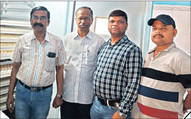
ସ୍ଵଳ୍ପ ପୁଲ୍ୟରେ ଯୋଗାଇ ଦିଆଯିବ। ଚିଆଁ ଗୁଡ଼ିକୁ ରାଜ୍ୟର ପ୍ରାଣୀପାଳକଙ୍କୁ

ଖସ୍ତିଆ ଠାରେ ଥିବା ବତକ ପ୍ରଜନନ ପାର୍ମ ରାଜ୍ୟର ପ୍ରାଣପାଳକ ଓ ଚାଷୀମାନଙ୍କ ସହାୟତା ପାଇଁ ବତକ ଚିଆଁ ଯୋଗାଇ ଆସୁଥିଲା ବେଳେ ବର୍ଷାଧିକ କାଳ ହେବ ବନ୍ଦ ରହିଥିଲା। ଏହି ବତକ ପାର୍ମ ରାଜ୍ୟ ସରକାରଙ୍କ ମଧ୍ୟ ଓ ପ୍ରାଣୀସମ୍ପଦ ବିଭାଗ ବିଭାଗ ଦ୍ଵାରା ଏବେ ପୁନଃ କାର୍ଯ୍ୟକ୍ଷମ ହୋଇଛି। ଏହି ପାର୍ମରେ ନୂତନ ଜୀବନଶୈଳୀ ସମ୍ପୂର୍ଣ୍ଣ ହୋଇଛି ଓ ସେଗର (ଚିଆଁପୁଠା ଯନ୍ତ୍ର) ସ୍ଥାପନ କରାଯାଇଛି। ପ୍ରାଥମିକ ଅବସ୍ଥାରେ ଏଥିରେ ତିନି ହଜାର ଅଧା ରଖାଯାଇଛି। ଯେଉଁଥିରୁ ୨୧ ଦିନ ପରେ ବତକ ଚିଆଁ ବାହାରିବେ। ଚିଆଁ ଗୁଡ଼ିକୁ ରାଜ୍ୟର ପ୍ରାଣୀପାଳକଙ୍କୁ