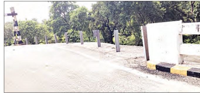
ବ୍ୟବସ୍ଥା କରାଯିବାକୁ ଦାବି ହେଉଛି। ଜେନାପୁର ପଟ୍ଟ ଗାଆଁରେ ଏକ ବୁଲାଇ ବ୍ରିଜ୍ ରହିଛି। ତେଣୁ ଏହି ରାସ୍ତାରେ ଭାରସାମ୍ୟ ସୁବନା ମୁତାବକ, ଏହି ବ୍ରିଜ୍

ଯାଜପୁର ଜିଲ୍ଲା ଧର୍ମଶାଳା ବୁଦ୍ଧ ଅନ୍ତର୍ଗତ ଜେନାପୁରଠାରେ ରସୁଲପୁର ବୁଦ୍ଧଙ୍କୁ ସଂଯୋଗ କରୁଥିବା ବ୍ରାହ୍ମଣୀ ନଦୀ ଉପରେ ଥିବା ଜେନାପୁର-ଜାବରା ବ୍ରିଜ୍ରେ ଦୈନିକ ଛୋଟ ବଡ଼ ଦୁର୍ଘଟଣା ଘଟି ଧନ କ୍ଷତି ହେଉଥିବା ଅଭିଯୋଗ ହେଉଛି।