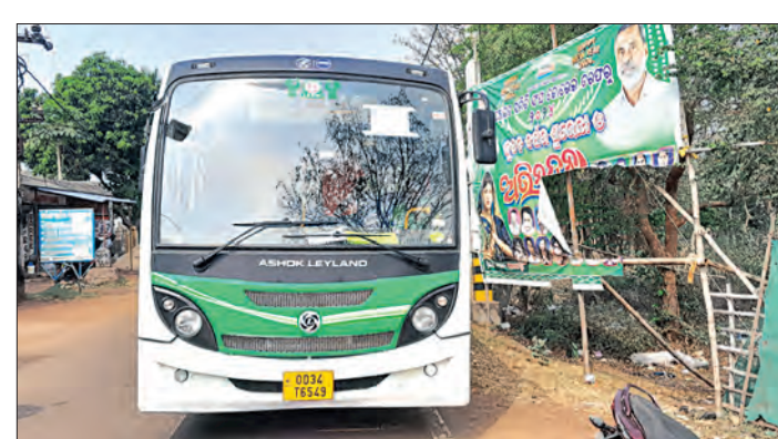
କରିବ, ଚାଷୀଙ୍କୁ ମାର୍କେଟ୍ ସହିତ ଯୋଡ଼ିବ, ଯାତାୟତ କରିବା ପାଇଁ ମାତ୍ର ପାଞ୍ଚ ଟଙ୍କା ପିଲାଙ୍କୁ ସ୍କୁଲ ନେବା ଆଣିବାରେ ସହାୟକ ହେବ ବୋଲି ସାଧାରଣରେ ଆଲୋଚନା ହେଉଛି। ମାଆ ଓ ଛାତ୍ରଛାତ୍ରୀ ଏହି ବସରେ ଯାତାୟତ କରିବା ପାଇଁ ମାତ୍ର ପାଞ୍ଚ ଟଙ୍କା ପିଲାଙ୍କୁ ସ୍କୁଲ ନେବା ଆଣିବାରେ ସହାୟକ ହେବ ବୋଲି ସାଧାରଣରେ ଆଲୋଚନା ହେଉଛି। ମାଆ ଓ ଛାତ୍ରଛାତ୍ରୀ ଏହି ବସରେ

ବସ୍ଟି କୋରେଇ ବୁଦ୍ଧ କାର୍ଯ୍ୟାଳୟର ବାହାରି କୁଆଖିଆ ଦେଇ ସାଦକପୁର ପଞ୍ଚାୟତରେ ପହଞ୍ଚିଲେ। ଉକ୍ତ ବସ୍ଟି ଧନେଶ୍ଵର, ପାଣିକୋଇଲି, ଗୋଲେଇପୁର, ଜହ୍ନା, ଖମ୍ବରା ଆଦି ପଞ୍ଚାୟତ ଦେଇ ଯାତାୟତ କରୁଛି।