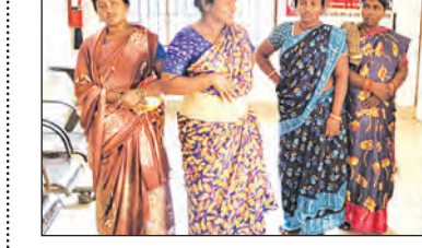
ପଞ୍ଚାୟତ ଗୋଦାମ ଗୃହଭାଙ୍ଗି ଚୋରି କେଳେ ଧରାପଡ଼ିଲେ

ଡ଼ସ୍‌କାନ୍ଦ ଚାଣିକିଠାରୁ ମିଳିଥିବା ସୂଚନା ଅନୁଯାୟୀ, ଗିରଫ କରାଯାଇଥିବା ଏକ ଦଳ ଚୋର ଗଠି ନେଇ କର୍ମସାଧକ ବେପାର କରୁଥିଲେ ଏବଂ ମୌକା