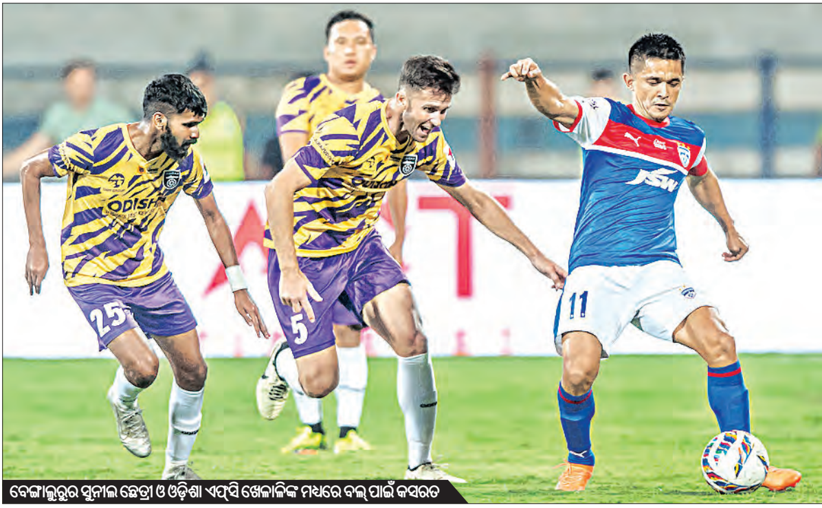
ବେଙ୍ଗାଲୁରୁର ପୁନାଲ କେପ୍ଟା ଓ ଓଡ଼ିଶା ଏସ୍‌ସି ଖେଳାଳିଙ୍କ ମଧ୍ୟରେ ବଲ୍ ପାଇଁ କସରତ