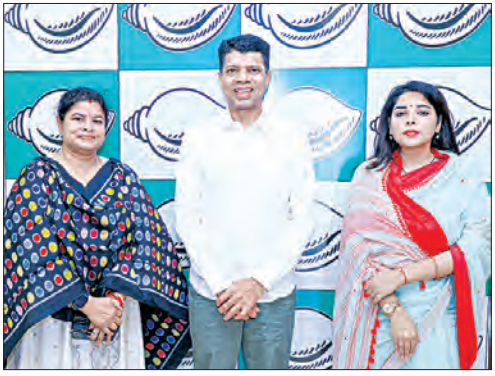
ଟିକଟ ପାଇବା ପରେ ନବୀନ ନିବାସରେ ମୁଖ୍ୟମନ୍ତ୍ରୀ ନବୀନ ପଟ୍ଟନାୟକ ଓ 'ନବୀନ ଓଡ଼ିଶା ଅଧ୍ୟକ୍ଷ' କାର୍ତ୍ତିକ ପାଣିଆନଙ୍କୁ ଭେଟୁଛନ୍ତି ଦଳୀୟ ନେତା