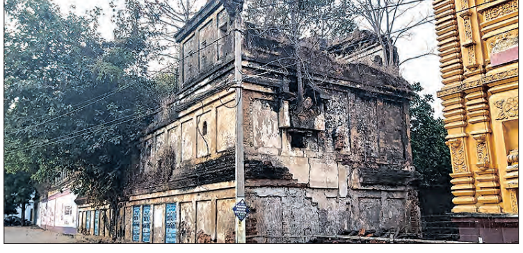
ନ ହେଲେ କେତେବେଳେ କାନ୍ଥ ଭାଙ୍ଗି ରାଷ୍ଟ୍ରା ଉପରେ ପଡ଼ି ପାରେ। ଐତିହାସ ସମ୍ପୂର୍ଣ୍ଣ ଏହି ପୁରାତନ କୀର୍ତ୍ତିରାଜି ଧ୍ୱଂସ ହୋଇ ମାଟିରେ ମିଶି କାଳକୁ ସୋନପୁର ରାଜତନ୍ତ୍ରର ସୁବର୍ଣ୍ଣପୁର ଛତାଯାଏ। ସୁବର୍ଣ୍ଣପୁର ସମୃଦ୍ଧ ଇତିହାସର ମୂଳସାକ୍ଷୀ ସାଜିଛି ଏହି ଅର୍ଦ୍ଧଶତାବ୍ଦୀ ରାଜପ୍ରାସାଦ।