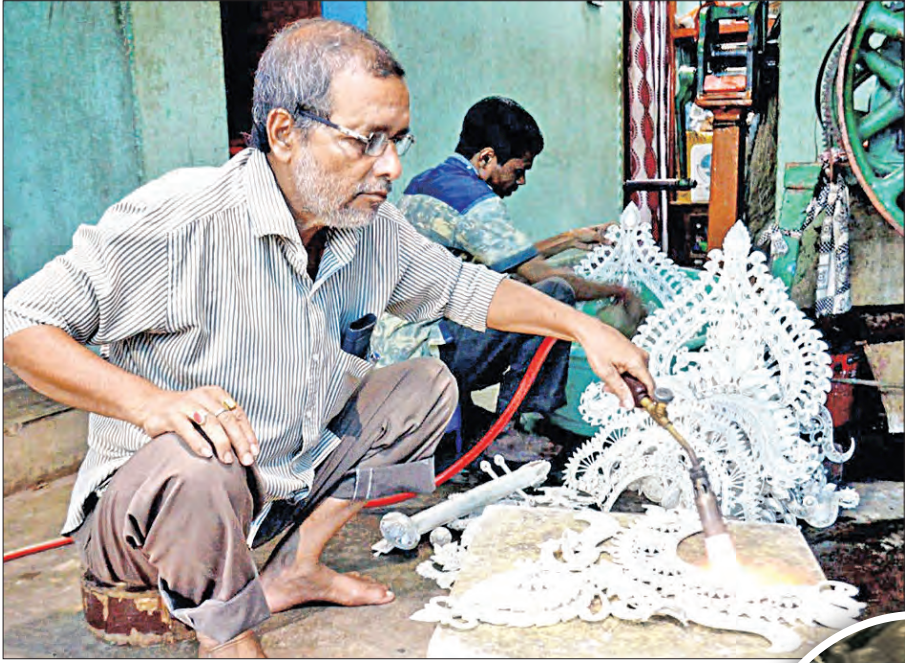
କଟକ, ୨୩ (ସମ୍ପାଦକ)