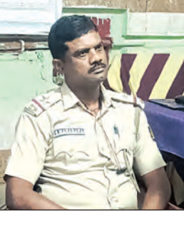
ପୁରନାପୋଲିସ୍, ତାହୁଁ ଥାନା ଅଧୀନ ରାଜନିଗୁଡ଼ା ଗ୍ରାମର ମଜୁରୀ କାମ ଗତ ଫେବୃଆରୀ...