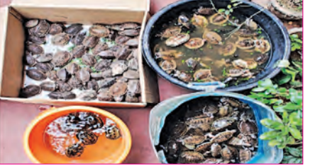
ଦୁଇ ଓଡ଼ିଆ ଯୁବକଙ୍କୁ ଧରିଲା ତିଆରୁଆଇ

ଭୁବନେଶ୍ୱର, ୨୮ ମାର୍ଚ୍ଚ (ସମ୍ବିଧ): ଚେନ୍ନାଇ ଚାଲାଇ ହେଉଥିବା ୪ ପ୍ରକାରିର ମୋଟ ୩୯୬ଟି ଭାରତୀୟ କଇଁଛଙ୍କୁ ରାଜ୍ୟ ଗୁରୁତ୍ୱ ନିର୍ଦ୍ଦେଶାଳୟ (ତିଆରୁଆଇ) ବିଶାଖାପାଟଣାରେ ରେଳସ୍ଟେ ସ୍ୱେସନ୍‌ରୁ ଉଦ୍ଧାର କରିବା ସହ ଏହି ଦେଶୀୟ କାରବାର ଅଭିଯୋଗରେ ଓଡ଼ିଶାର ଦୁଇଜଣ ଯୁବକଙ୍କୁ ଗିରଫ କରିଛି । ଓଡ଼ିଶା ଓ କୋଲକାତାରୁ ଏହି କଇଁଛଗୁଡ଼ିକ ସଂଗ୍ରହ କରି ଚେନ୍ନାଇ ଚାଲାଇ କରାଯାଉଥିବା ଜଣାଯାଇଛି । ଜବତ କଇଁଛଗୁଡ଼ିକୁ ଆନ୍ଧ୍ରପ୍ରଦେଶର ବନ୍ ବିଭାଗକୁ ହସ୍ତାନ୍ତର କରାଯାଇଛି । ଜବତ କଇଁଛଗୁଡ଼ିକ ମଧ୍ୟରୁ ୨୨୦ଟି ଭାରତୀୟ ଚେଷ୍ଟ କଇଁଛ, ୧୫୯ଟି ଭାରତୀୟ ରୁଫେଟ୍ କଇଁଛ, ୧୬ଟି ବ୍ରାଉନ୍ ରୁଫେଟ୍ କଇଁଛ ଓ ୯୯ଟି ଭାରତୀୟ କ୍ରାଉନ୍‌ଡ କଇଁଛ ରହିଥିବା ଜଣାଯାଇଛି । ବନ୍ୟପ୍ରାଣୀ ସୁରକ୍ଷା ଆଇନ