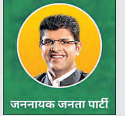
ଜନନାୟକ ଜନତା ପାର୍ଟି

କୁରୁକ୍ଷେତ୍ର, ୨୮ ମାର୍ଚ୍ଚ (ଏକେନ୍ଦ୍ର): ଜନନାୟକ ଜନତା ପାର୍ଟି (ଜେଜେପି) ହରିୟାଣାର ସମସ୍ତ ୧୦ ଲୋକସଭା ଆସନରେ ପ୍ରାର୍ଥୀ ଦେବ ବୋଲି ଜେଜେପି ମୁଖ୍ୟ ଦୁଷ୍ୟନ୍ତ ଚୌତାଳ ଘୋଷଣା କରିଛନ୍ତି । ରାଜ୍ୟରେ ଜେଜେପି-ଜେଜେପିର ମେଣ୍ଟ ସରକାର ଥିଲା । ସରକାରର ଅଂଶଦାର ଦଳର ନେତା ଭାବେ ଦୁଷ୍ୟନ୍ତ ଉପମୁଖ୍ୟମନ୍ତ୍ରୀ ଥିଲେ । ତେବେ ଲୋକସଭା ନିର୍ବାଚନ ତାରିଖ ଘୋଷଣା ପୂର୍ବରୁ ଆସନ ବନ୍ଧନକୁ ନେଇ ଦୁଇ ଦଳ ମଧ୍ୟରେ ପାର୍ଟି ଦେଖାଦେଲା । ଜେଜେପି ଏବେ ବିଜେପିଠାରୁ ଦୂରରେଇଯାଇଛି, ମେଣ୍ଟ ଗଠନରେ ବିପକ୍ତ ହୋଇ ଗତ ୧୨ ତାରିଖରେ ମନୋହରଲାଲ ଖଟ୍ଟର ମୁଖ୍ୟମନ୍ତ୍ରୀ ପଦକୁ ଲକ୍ଷ୍ମଣା ଦେଇଛନ୍ତି ଓ ଖଟ୍ଟରଙ୍କ ସ୍ଥାନରେ ନାୟାବ ସୈନି ସ୍ୱାଧୀନ ବିଧାୟକମାନଙ୍କ ସମ୍ପର୍କରେ ମୁଖ୍ୟମନ୍ତ୍ରୀ ହୋଇଛନ୍ତି । ଦୁଷ୍ୟନ୍ତଙ୍କ ଜେଜେପି କୌଣସି ଦଳ ସହ ମେଣ୍ଟ ନକରି ଏକାକୀ ରାଜ୍ୟର ସମସ୍ତ ୧୦ ଲୋକସଭା ଆସନରେ ଲଢ଼ିବାକୁ ପ୍ରସ୍ତୁତ ହୋଇଛି । ୨୦୧୯ରେ ହରିୟାଣାର ସମସ୍ତ ୧୦ ଲୋକସଭା ଆସନରେ ବିଜେପି ପ୍ରାର୍ଥୀ ଜିତିଥିଲେ । ଲୋକସଭା ନିର୍ବାଚନ ପାଇଁ ହରିୟାଣାରେ ମୋଟ ୨୫ ତାରିଖରେ ମତଦାନ ହେବ ଓ କୁଳ ୪ରେ ପକାପକ ପ୍ରକାଶ ପାଇବ ।