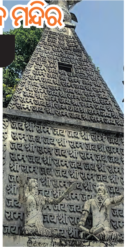
ବସିଛନ୍ତି । ଏହି ମନ୍ଦିରର ଆଖପାଖରେ ୩୬ଟି ମନ୍ଦିର ରହିଛି । ପ୍ରତିଟି ମନ୍ଦିରର କାନ୍ଧ ଓ ଚତାଗରେ ଏଠାକୁ ଆସୁଥିବା ଶୁଦ୍ଧାଳୁକମାନେ 'ଜୟ ଶ୍ରୀରାମ' ଲେଖିଥାନ୍ତି ।

ଆମ ଦେଶରେ କିଛି ସ୍ଥାନରେ ଶୁଦ୍ଧାଳୁକ ମନ୍ଦିର ପ୍ରବେଶକୁ ନେଇ ସ୍ୱତନ୍ତ୍ର ନିୟମ ରହିଛି । ସେମାନଙ୍କ ମଧ୍ୟପ୍ରଦେଶ, ଜୟପୁର ସ୍ଥିତ 'ଅପନେ ରାମ କା ନିରାଳା ଧାମ' ମନ୍ଦିରକୁ ଯିବା ପାଇଁ ଶୁଦ୍ଧାଳୁକ ପ୍ରଥମେ ୧୦୮ ଥର ରାମନାମ ଲେଖିବାକୁ ପଡ଼େ । ମନ୍ଦିର ସମ୍ପର୍କରେ ସବୁଠୁ ଆଶ୍ଚର୍ଯ୍ୟର କଥା ହେଉଛି, ଏଠାରେ ପୂଜାରୀ ନାହାନ୍ତି କି ଭଗବାନଙ୍କୁ ପ୍ରସାଦ ମଧ୍ୟ ଚଳା ଯାଏ ନାହିଁ । ମନ୍ଦିରକୁ ଯାଉଥିବା ଶୁଦ୍ଧାଳୁକ ପ୍ରସାଦ ନେଇ ଯିବାର ମଧ୍ୟ ଆବଶ୍ୟକତା ନାହିଁ । କେବଳ ସେତିକି ନୁହେଁ, ଏହି ମନ୍ଦିରରେ ହୁଣ୍ଡି ମଧ୍ୟ ନାହିଁ । ଖାସ୍ ଏହି କାରଣରୁ ହନୁମାନଙ୍କ ଏହି ମନ୍ଦିର ସ୍ଥାନୀୟ ଅଞ୍ଚଳରେ ଚର୍ଚ୍ଚାରେ ରହିଛି । ୧୯୯୦ରେ ସ୍ଥାପନା କରାଯାଇଥିବା ଏହି ମନ୍ଦିରର ବହୁଗୁଣରେ ରାମନାମ ଲେଖାଯାଇଛି । ମନ୍ଦିରରେ ରାବଣ, ମେନାଥ, କୁମ୍ଭକର୍ଣ୍ଣ ଏବଂ ମନ୍ଦୁକା ମଧ୍ୟ ପ୍ରତିମା ରହିଛି । ଏହି ମନ୍ଦିରରେ ୧୨୯ ଫୁଟ ଉଚ୍ଚର ହନୁମାନ ମୂର୍ତ୍ତି ସୁବାବେଳେ ତାଙ୍କ କାନ୍ଧରେ ପ୍ରଭୁ ରାମ ଏବଂ ଲକ୍ଷ୍ମଣ