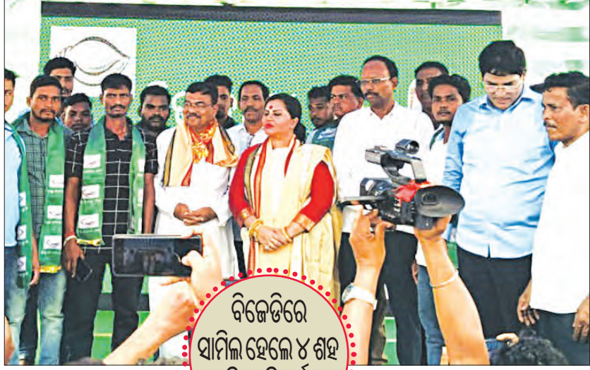
ବିଜେଡିରେ ସାମିଲ ହେଲେ ୪ ଶହ ବିଜେପି କର୍ମୀ