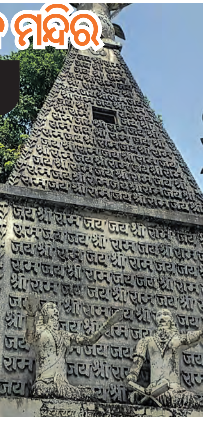
ବସିଛନ୍ତି । ଏହି ମନ୍ଦିରର ଆଖପାଖରେ ୩୬୦ଟି ମନ୍ଦିର ରହିଛି । ପ୍ରତିଟି ମନ୍ଦିରର କାନ୍ଧ ଓ ଚଟାଣରେ ଏଠାକୁ ଆସୁଥିବା ଶ୍ରୀକାଳୁମାନେ 'ଜୟ ଶ୍ରୀରାମ' ଲେଖିଥାନ୍ତି ।

ଆମ ଦେଶରେ କିଛି ସ୍ଥାନରେ ଶ୍ରୀକାଳୁଙ୍କ ମନ୍ଦିର ପ୍ରବେଶକୁ ନେଇ ସ୍ୱତନ୍ତ୍ର ନିୟମ ରହିଛି । ଯେମିତି ମଧ୍ୟପ୍ରଦେଶ, ଜୟପୁର ଭିତ 'ଅପନେ ରାମ କା ନିରାଲା ଧ୍ୟାନ' ମନ୍ଦିରକୁ ଯିବା ପାଇଁ ଶ୍ରୀକାଳୁଙ୍କୁ ପ୍ରଥମେ ୧୦୮ ଥର ରାମନାମ ଲେଖିବାକୁ ପଡ଼େ । ମନ୍ଦିର ସମ୍ପର୍କରେ ସବୁଠୁ ଆଶ୍ଚର୍ଯ୍ୟର କଥା ହେଉଛି, ଏଠାରେ ପୂଜାରୀ ନାହାନ୍ତି କି ଭଗବାନଙ୍କୁ ପ୍ରସାଦ ମଧ୍ୟ ଚଳା ଯାଏ ନାହିଁ । ମନ୍ଦିରକୁ ଯାଉଥିବା ଶ୍ରୀକାଳୁଙ୍କୁ ପ୍ରସାଦ ନେଇ ଯିବାର ମଧ୍ୟ ଆବଶ୍ୟକତା ନ ଥାଏ । କେବଳ ସେତିକି ନୁହେଁ, ଏହି ମନ୍ଦିରରେ ହୁଣ୍ଡି ମଧ୍ୟ ନାହିଁ । ଖାସ୍ ଏହି କାରଣରୁ ହନୁମାନଙ୍କୁ ଏହି ମନ୍ଦିର ସ୍ଥାନୀୟ ଅଞ୍ଚଳରେ ଚର୍ଚ୍ଚାରେ ରହିଛି । ୧୯୯୦ରେ ସ୍ଥାପନା କରାଯାଇଥିବା ଏହି ମନ୍ଦିରର ବହୁତ ପାର୍ଶ୍ୱରେ ରାମନାମ ଲେଖାଯାଇଛି । ମନ୍ଦିରରେ ରାବଣ, ମେନାଥ, କୁମ୍ଭକର୍ଣ୍ଣ ଏବଂ ମନ୍ତ୍ରାଳୟ ମଧ୍ୟ ପ୍ରତିମା ରହିଛି । ଏହି ମନ୍ଦିରରେ ୧୨୯ ଫୁଟ ଉଚ୍ଚର ହନୁମାନ ମୂର୍ତ୍ତି ଥିବାବେଳେ ତାଙ୍କ କାନ୍ଧରେ ପ୍ରଭୁ ରାମ ଏବଂ ଲକ୍ଷ୍ମଣ