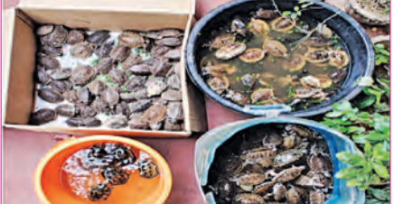
ଦୁଇ ଓଡ଼ିଆ ଯୁବକଙ୍କୁ ଧରିଲା ତିଆରିଆଇ

ଭୁବନେଶ୍ୱର, ୨୮ ମାର୍ଚ୍ଚ (ସମ୍ବିଧ): ଚେନ୍ନାଇ ଚାଲିଯାଇ ହେଉଥିବା ୪ ପ୍ରକାରିର ମୋଟ ୩୯୬ଟି ଭାରତୀୟ କଇଁଛକୁ ରାଜ୍ୟ ଗ୍ରହଣ ନିର୍ଦ୍ଦେଶାଳୟ (ଡିଆରଆଇ) ବିଶାଖାପାଟଣାରେ ରେଳସ୍ଥି ସ୍ୱେଦନରୁ ଉଦ୍ଧାର କରିବା ସହ ଏହି ବେଆଇନ କାରବାର ଅଭିଯୋଗରେ ଓଡ଼ିଶାର ଦୁଇଜଣ ଯୁବକଙ୍କୁ ଗିରଫ କରିଛି । ଓଡ଼ିଶା ଓ କୋଲକାତାରୁ ଏହି କଇଁଛଗୁଡ଼ିକ ସଂଗ୍ରହ କରି ଚେନ୍ନାଇ ଚାଲିଯାଇ କରାଯାଉଥିବା ଜଣାଯାଇଛି । ଜବତ କଇଁଛଗୁଡ଼ିକୁ ଆକ୍ରମଣକାରୀ ବନ୍ଦ ବିଭାଗକୁ ହସ୍ତାନ୍ତର କରାଯାଇଛି । ଜବତ କଇଁଛଗୁଡ଼ିକ ମଧ୍ୟରୁ ୨୨୦ଟି ଭାରତୀୟ ଚେଷ୍ଟ କଇଁଛ, ୧୫୯ଟି ଭାରତୀୟ ରୁପେଟ କଇଁଛ, ୧୬ଟି ବ୍ରାଉନ୍ ରୁପେଟ କଇଁଛ ଓ ୯ଟି ଭାରତୀୟ କ୍ରାଉନଡ କଇଁଛ ରହିଥିବା ଜଣାଯାଇଛି । ବନ୍ୟପ୍ରାଣୀ ସୁରକ୍ଷା ଆଇନ