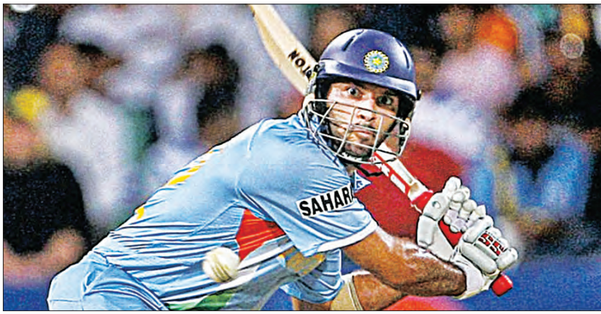
ଛକା ସହାୟତାରେ ଅପରାଜିତ ୧୬୨ ରନର ଶତକାୟ ପାଳି ଖେଳିଥିଲେ ।

୨୦୧୩ ଏପ୍ରିଲ ୨୩ରେ ଆଇପିଏଲରେ ସବୁଠାରୁ ବଡ଼ ଦକାୟ ଘୋର ଦେଖିବାକୁ ମିଳିଥିଲା । ପୁଣି ଉପରୋକ୍ତ ବିପକ୍ଷରେ ରୟାଲ ଚ୍ୟାଲେଞ୍ଜର୍ସ ବେଙ୍ଗାଲୁରୁ (ଆରସିବି) ୫ ଓଭରରେ ହରାଇ ଆଇପିଏଲର ସର୍ବବୃହତ ଘୋର ୨୬୩ ରନ ସଂଗ୍ରହ କରିଥିଲା । କିନ୍ତୁ ଅନ୍ତର୍ଜାତୀୟ କ୍ରିକେଟରେ ଏହାଠାରୁ ବଡ଼ ଘୋର ୩୩୯ ରନ ସଂଗ୍ରହ ହୋଇଥିଲା । ୨୦୨୩ ସେପ୍ଟେମ୍ବର ୨୭ରେ ନେପାଳ ମହୋଦୀ ବିପକ୍ଷରେ ୩୦୦ରୁ ଅଧିକ ଅନ୍ତର୍ଜାତୀୟ ରନ ସଂଗ୍ରହ କରିଥିଲା । କିନ୍ତୁ ଆଇପିଏଲରେ ୩୦୦ରୁ ଅଧିକ ରନ ସଂଗ୍ରହ ହୋଇନାହିଁ । ୨୦୧୯ରେ ଆଇପିଏଲରେ ଆପ୍ତାଗାନ୍‌ସାନ ୩ ଓଭରରେ ହରାଇ ୨୬୮ ରନ ସଂଗ୍ରହ କରିଥିଲା । ଏହି ମ୍ୟାଚ୍‌ରେ ହଜରତୁଲ୍ଲା ଜକାଲ ୧୨