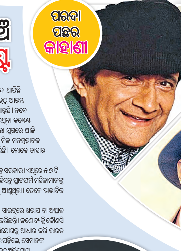
ପରଦା ପଛର କାହାଣୀ