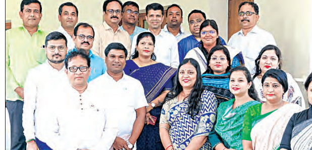
ସେଲ୍ ସଦସ୍ୟମାନେ ବିଭି ତିବେଟ୍ ଓ ଅନ୍ୟାନ୍ୟ ଗଣମାଧ୍ୟମରେ ରାଜ୍ୟ ସରକାରଙ୍କ ଉପକ୍ରମକୁ ଜନସାଧାରଣଙ୍କ ସାମୁଦ୍ରିକ ପ୍ରସ୍ତୁତ କରିବେ ବୋଲି ନିଷ୍ପତ୍ତି ହୋଇଥିଲା। ଏହି ବୈଠକ ପରେ ସଂସଦ