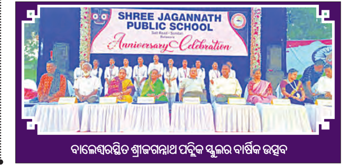
ବାଲେଶ୍ୱରର ଶ୍ରୀଜଗନ୍ନାଥ ପବ୍ଲିକ୍ ସ୍କୁଲର ବାର୍ଷିକ ଉତ୍ସବ