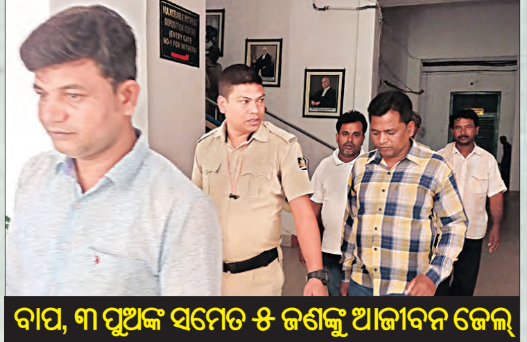
ବାପ, ଗା ପୁଅଙ୍କ ସମେତ ୫ ଜଣଙ୍କୁ ଆଜୀବନ ଜେଲ୍