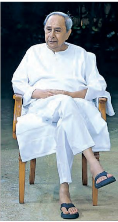
ଜଗତସିଂହପୁର ଆସନ ଏବଂ ଏହା ଅନ୍ତର୍ଗତ ବିଧାନସଭା ଆସନ ଫଳାଫଳରେ ଆଲୋଚନା ହୋଇଥିଲା। ମୁଖ୍ୟମନ୍ତ୍ରୀ ଦଳୀୟ ପର୍ଯ୍ୟବେକ୍ଷକ ଓ ଅନ୍ୟ ନେତାମାନଙ୍କ ସହ ଜଣକଣକ କରି ପ୍ରତି ଲୋକସଭା ଓ ବିଧାନସଭା ନିର୍ବାଚନମଣ୍ଡଳୀରେ