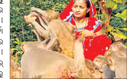
ପିଞ୍ଜରରେ ଆବଦ୍ଧ ମାଙ୍କଡ଼ ଉଦ୍ଧାର, ଦମ୍ପତି ଫେରାର୍

ଭୁବନେଶ୍ଵର/ଯାଜପୁର, ୨୪।୩(ସମିପ): ବନ୍ୟଜନ୍ତୁ ସୁରକ୍ଷା ଆଇନର ଉଲ୍ଲଙ୍ଘନକାରୀଙ୍କ ବିରୁଦ୍ଧରେ କାର୍ଯ୍ୟାନୁଷ୍ଠାନ ବ୍ୟାପକ କରିଛି ରାଜ୍ୟ ବନ ବିଭାଗ।