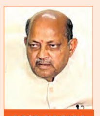
ନବୀନ ସରକାରକୁ ଜଣାଇଲେ ଧନ୍ୟବାଦ

■ ଭୁବନେଶ୍ୱର, ୨୨।୩ (ସମ୍ବିଧ): ବିଜେପି ରାଜ୍ୟର ସମସ୍ତ ୧୪୭ ବିଧାନସଭା ଆସନ ଓ ୨୧ ଟି ଲୋକସଭା ସିଟ୍‌ରେ ଏକାକୀ ଲଢ଼ିବ ବୋଲି ସାମାଜିକ ଗଣମାଧ୍ୟମ ‘ଏକ୍ସ’ରେ ସୂଚନା ଦେଇଛନ୍ତି ବିଜେପି ରାଜ୍ୟ ସଭାପତି ମନମୋହନ ସାମଲ । ଗତ କିଛି ଦିନ ହେବ ମେଣ୍ଟକୁ ନେଇ ଜାରି ରହିଥିବା ଚର୍ଚ୍ଚା, ବାରମ୍ବାର ମତ ପରିବର୍ତ୍ତନ ପରେ ଶେଷରେ ମନମୋହନ ଦଳ ସମସ୍ତ ବିଧାନସଭା ଓ ଲୋକସଭା ଆସନରେ ଏକାକୀ ଲଢ଼ିବ ବୋଲି ନିଜର ମତ ସ୍ପଷ୍ଟ କରିଛନ୍ତି। ଅନ୍ୟପକ୍ଷରେ ଏହି ଚିପ୍ପଣୀରେ ମନମୋହନ ରାଜ୍ୟରେ ନବୀନ ପଟ୍ଟନାୟକଙ୍କ ନେତୃତ୍ୱାଧୀନ ବିଜେଡି ସରକାରକୁ ମଧ୍ୟ ଧନ୍ୟବାଦ ଜଣାଇଛନ୍ତି। ଏକ ଦୀର୍ଘ ଘୋଷଣାରେ ସେ ଉଲ୍ଲେଖ କରିଛନ୍ତି ଯେ ଗତ ୧୦ ବର୍ଷ ଧରି ନବୀନ ପଟ୍ଟନାୟକଙ୍କ ନେତୃତ୍ୱରେ ଓଡ଼ିଶାର ବିଜୁ ଜନତା ଦଳ ପ୍ରଧାନମନ୍ତ୍ରୀ ନରେନ୍ଦ୍ର ମୋଦୀଙ୍କ