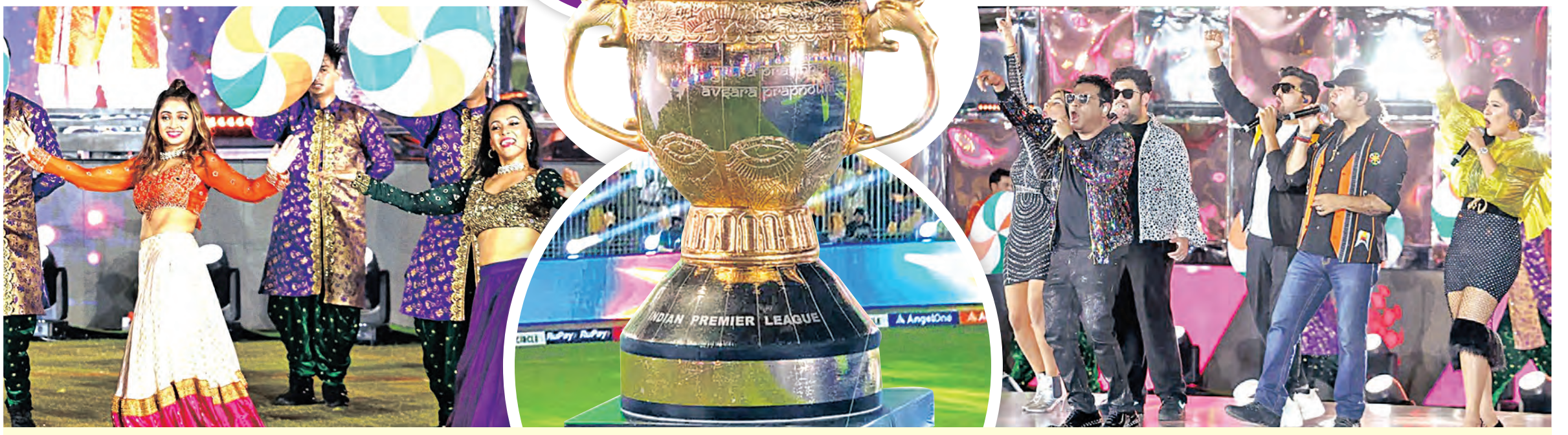
ଚେନ୍ନାଇର ଏମ୍‌ଏ ଚିଦାମ୍ବରମ ଷ୍ଟାଡ଼ିୟମରେ ଶୁକ୍ରବାର ଅନୁଷ୍ଠିତ ଆଇପିଏଲ୍-୧୭ର ଉଦ୍‌ଘାଟନା ଉତ୍ସବରେ ବଲିଉଡ୍ କଳାକାର ଅକ୍ଷୟ କୁମାର ଓ ସଙ୍ଗୀତକାର ଏଆର୍ ରହମାନ ସାଥ୍ କଳାକାରମାନଙ୍କ ସହ କାର୍ଯ୍ୟକ୍ରମ ପରିବେଷଣ କରି ଦର୍ଶକଙ୍କ ମନୋରଞ୍ଜନ କରୁଛନ୍ତି ।