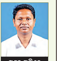
ପ୍ରଶ୍ନ ପୂର୍ଣ୍ଣଛେଦ ରଣଭେରା ତିନି ଚତୁର୍ଥାଂଶ ଆସନରେ ବିଜୟ ନିଶ୍ଚିତ