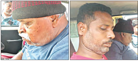
ଆମ୍ବୁଲାନ୍ସ ଚାଳକ ଓ ବୃଦ୍ଧ ଅଟକ ଆମ୍ବୁଲାନ୍ସ, ଗୀତି ହାତକଡ଼ି, ଦୁଇଟି କଳାମୁଖା, ଗୋଟିଏ ବାଡ଼ି, ଛୁରି ଜବତ

କଳାବାଡ଼ିଆ, ୨୨।୩। (ସମ୍ପାଦକ): ସଂପୃକ୍ତ ରହିଛି। ସେମାନଙ୍କୁ ଧରିବା ସିବିଆଇ ଅଧିକାରୀ କହି ଜଣେ ଯୁବକଙ୍କୁ ଅପହରଣ ଉଦ୍ୟମ ଆଜି ମୟୂରଭଞ୍ଜ ଜିଲ୍ଲାରେ ଚର୍ଚ୍ଚାର ବିଷୟ ହୋଇଛି।