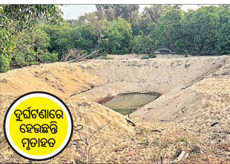
ଦୁର୍ଘଟଣାରେ ହେଉଛନ୍ତି ମୃତାହତ

ପୁରୀ, ୨୨।୩ (ସମ୍ବିଧ): ସମୁଦ୍ର କୁଳରେ ବାଲୁଖଣ୍ଡ ଅଭୟାରଣ୍ୟ ଏକ ସୁନ୍ଦର ସୃଷ୍ଟି । ମନୁଷ୍ୟକୃତ ଏହି ଅଭୟାରଣ୍ୟରେ ଗାଡୁଆଳୁ, କୁକୁରା, ଠକୁଆ ଆଦି ବିଭିନ୍ନ ପ୍ରକାର ଜୀବଜନ୍ତୁ ରହୁଥିଲେ ମଧ୍ୟ ଏଠାରେ ପ୍ରମୁଖ ଆକର୍ଷଣ ହେଉଛି ଚିତ୍ରା ହରିଣ । ପୂର୍ବରୁ ଏଠାରେ କୃଷ୍ଣସାର ହରିଣ ଦେଖାଯାଉଥିଲେ । ପ୍ରାୟ ୯ ବର୍ଷ ହେବ କୃଷ୍ଣସାର ଆଉ ଦେଖିବାକୁ ମିଳୁନାହାନ୍ତି । କେବଳ ଏଠାରେ ଚିତ୍ରା ହରିଣ ରହିଥିବା ବେଳେ ବାଟ୍ୟା ପନି ପରେ ଏମାନଙ୍କ ଫଖ୍ୟା ଯଥେଷ୍ଟ କମିଯାଇଛି । କିନ୍ତୁ ଯାହା ବି ହରିଣ ଅଛନ୍ତି ସେମାନଙ୍କୁ ପର୍ଯ୍ୟାପ୍ତ ଖାଦ୍ୟ-ପାନୀୟ ମିଳୁନାହିଁ । ଜଙ୍ଗଲ ଭିତରେ ଯଦି ବିଭିନ୍ନ ଗଛର ପତ୍ର ଓ ଘାଷ ଖାଇ ଭୋକ ମେଣ୍ଟାଇଛନ୍ତି କିନ୍ତୁ ପାଣିର ଘୋର ଅଭାବ ରହିଛି । ପକ୍ଷରେ ବିଭିନ୍ନ ସମୟରେ ପାଣି ପାଇଁ ବାଟ ହୁଡୁଛନ୍ତି ହରିଣ । ଅନେକ ସମୟରେ ଜନସମ୍ପର୍କିତ ହେଉଥିବା ହରିଣ ବିପଦରେ ପଡୁଛନ୍ତି । କେତେବେଳେ ବୁଲୁ କୁକୁରା ଶିକାର ହେଉଛନ୍ତି ତ ପୁଣି କେତେବେଳେ ଗାଡ଼ି ଦୁର୍ଘଟଣାରେ ପ୍ରାଣ ହରାଇଛନ୍ତି । ଏପରିକି ଡ୍ରୋନ୍‌ରେ ପଡ଼ି ଏମାନଙ୍କ ଜୀବନ ଯାଉଛି । ଏପରି ନିୟମିତ ବ୍ୟବଧାନରେ ହରିଣକୁ ଠାବ କରାଯାଉଛି ।