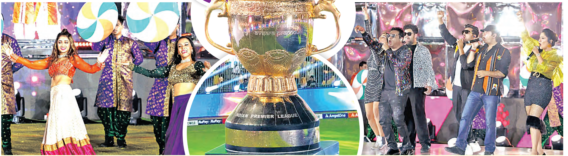
ଚେନ୍ନାଇର ଏମ୍‌ଏ ଚିଦାମ୍ବରମ ଷ୍ଟାଡ଼ିୟମରେ ଶୁକ୍ରବାର ଅନୁଷ୍ଠିତ ଆଇପିଏଲ୍-୧୭ର ଉଦ୍‌ଘାଟନା ଉତ୍ସବରେ ବଲିଉଡ୍ କଳାକାର ଅକ୍ଷୟ କୁମାର ଓ ସଙ୍ଗୀତକାର ଏଆର ରହମାନ ସାଥ୍ କଳାକାରମାନଙ୍କ ସହ କାର୍ଯ୍ୟକ୍ରମ ପରିବେଷଣ କରି ଦର୍ଶକଙ୍କ ମନୋରଞ୍ଜନ କରୁଛନ୍ତି ।