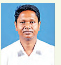
ପ୍ରଶ୍ନ ପୂର୍ଣ୍ଣଛେଦ ରଣଭେରା ତିନି ଚତୁର୍ଥାଂଶ ଆସନରେ ବିଜୟ ନିଶ୍ଚିତ