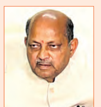
ନବୀନ ସରକାରକୁ ଜଣାଇଲେ ଧନ୍ୟବାଦ