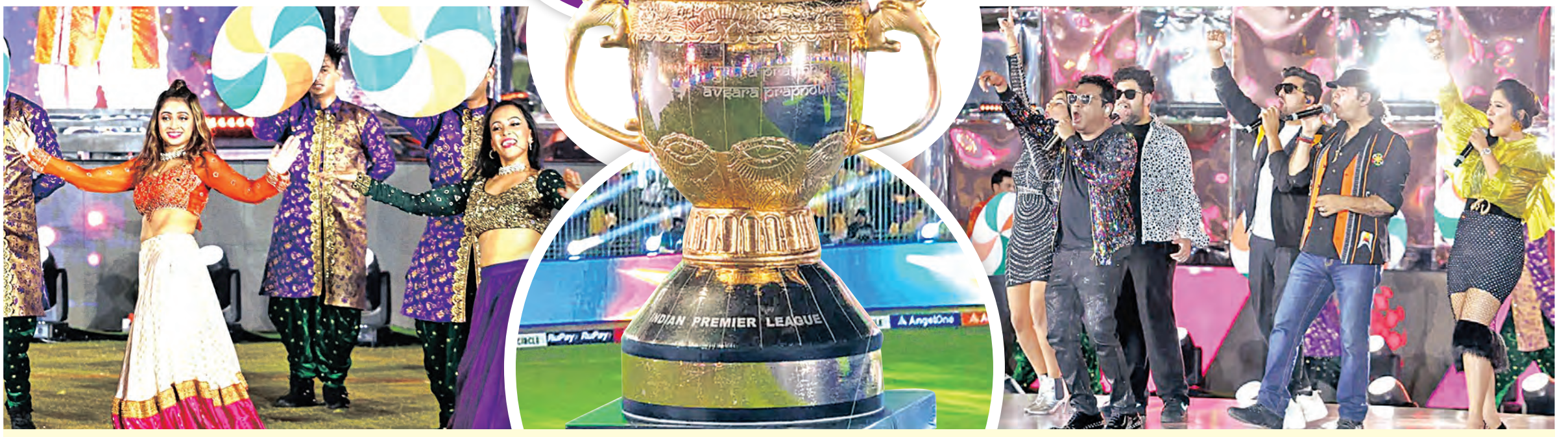
ଚେନ୍ନାଇର ଏମ୍‌ଏ ଚିଦାମ୍ବରମ ଷ୍ଟାଡ଼ିୟମରେ ଶୁକ୍ରବାର ଅନୁଷ୍ଠିତ ଆଇପିଏଲ୍-୧୭ର ଉଦ୍‌ଘାଟନା ଉତ୍ସବରେ ବଲିଉଡ୍ କଳାକାର ଅକ୍ଷୟ କୁମାର ଓ ସଙ୍ଗୀତକାର ଏଆର୍ ରହମାନ ସାଥ୍ କଳାକାରମାନଙ୍କ ସହ କାର୍ଯ୍ୟକ୍ରମ ପରିବେଷଣ କରି ଦର୍ଶକଙ୍କ ମନୋରଞ୍ଜନ କରୁଛନ୍ତି ।