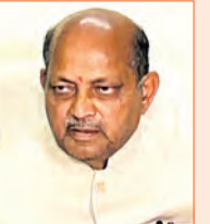
ନବୀନ ସରକାରକୁ ଜଣାଇଲେ ଧନ୍ୟବାଦ