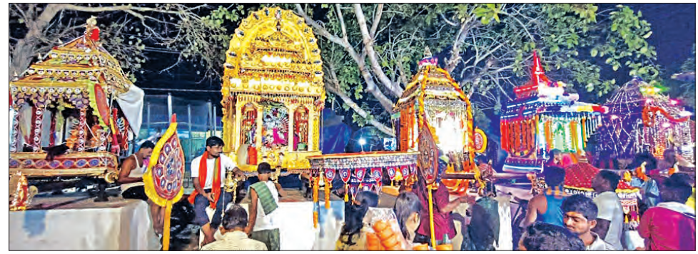
ରାତ୍ର ୧୦ଟାରେ ହରିହର ଭେଟ ଅନୁଷ୍ଠିତ ହୋଇଛି । ବିଭିନ୍ନ ପ୍ରକାର ଖାଦ୍ୟ ସାମଗ୍ରୀ, ମନୋହର ଜିନିଷ, ମାଟି ହାଣ୍ଡି, ଘରକରଣା ଦେବ, ସରାଟର ନାଳକଣ୍ଠେଶ୍ୱର ଦେବ, ଚରଡ଼ପଡ଼ାର

ବାଲିପାଟଣା, ୨୧ମା (ସମିଧା) ପ୍ରତ୍ୟେକ ଓଡ଼ିଆ ପାଇଁ ଦୋଳ ପର୍ବର ମହତ୍ତ୍ୱ ନିଆରା । ଏକାଦଶୀ ତିଥିରୁ ବାଲିପାଟଣାର ପ୍ରସିଦ୍ଧ ଦୋପତି ମେଳଣ ଆରମ୍ଭ ହୋଇ ଦହିକଡ଼ିରେ ଶେଷ ହୋଇଥାଏ । ଦୋପତି ମେଳଣ ହେଉଛି ଗାରେଡ଼ିପାଞ୍ଚାଶ ପଞ୍ଚାଶର ଆନପତି ମହାଦେବ ଶ୍ରୀଗୁଣ୍ଡ ଚୁରନାଥ ଦେବଙ୍କ ମେଳଣ । ଏହାପରେ ଲଗାତାର ପଞ୍ଚ ଦିନ ବ୍ୟାପୀ ପଞ୍ଚ ଦେ । ଲ