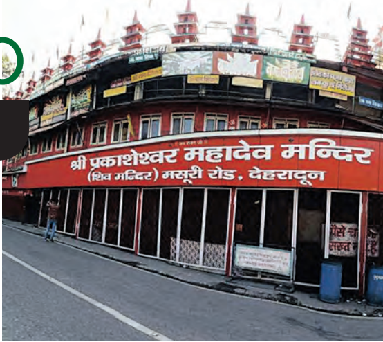
ଯାହା ଏହି ମନ୍ଦିରକୁ ଅନ୍ୟ ମନ୍ଦିରଠାରୁ ସ୍ୱତନ୍ତ୍ର କରୁଛି । ଏହି ମନ୍ଦିରର ଉପରିଭାଗରେ ୧୫୦ ରୁ ଅଧିକ ସଂଖ୍ୟକ ତ୍ରିଶୂଳ ନିର୍ମିତ ହୋଇଛି । ପାହାଡ଼ ପର୍ବତଯେରା ଏହି ଭବ୍ୟ ମନ୍ଦିର ଏହାର କାରୁକାର୍ଯ୍ୟ ଯୋଗୁଁ ମଧ୍ୟ ଭକ୍ତଙ୍କୁ ଆକର୍ଷିତ କରିଥାଏ ।