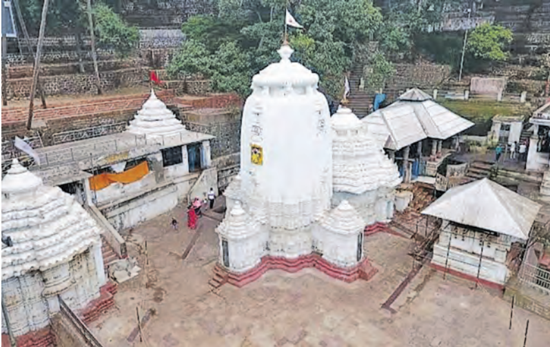
ପୂଜା ଓ ବେଳପତ୍ର ଦୋକାନ ପାଇଁ ୮ଲକ୍ଷ ୫୫ ହଜାର ୬ଶହ ୯୯ ଟଙ୍କା, କପିଳାସ ଓମପୋଡ଼ ପାଇଁ ଦୋକାନ ୪ ଲକ୍ଷ ୩୦ ହଜାର ୯୯ ଟଙ୍କା, କପିଳାସ ପାନ ଦୋକାନ ପାଇଁ ୩ ଲକ୍ଷ ୩୫ ହଜାର ୬ଶହ ୯୯ ଟଙ୍କା, କପିଳାସ ଶିଖର ଚଳୁଚକିଆ ଯାନ ଷ୍ଟାଲ୍ ପାଇଁ ୧୩ ଲକ୍ଷ ୩୪ ହଜାର ୩ଶହ ୯୯ ଟଙ୍କା,

ତାରିଖ ଏବଂ ମାର୍ଚ୍ଚ ୨୧ ତାରିଖରେ ଟେଣ୍ଡର ଆହ୍ୱାନ କରାଯାଇଥିବା ବେଳେ ଟେଣ୍ଡର ଖୋଲାଯିବାର ଧାର୍ଯ୍ୟ ତାରିଖ ମଧ୍ୟରେ କୌଣସି ଟେଣ୍ଡରଧାରୀ ପକ୍ଷରୁ ନଥିବା ଯୋଗୁଁ ଦେବଦଳର ବିଭାଗ ପାଇଁ ଚିନ୍ତାଧାରା କାରଣ ପାଲଟିଛି । ଏହି ଟେଣ୍ଡର ପ୍ରକ୍ରିୟାରେ ବଳଦେବ ଜାୟୁ ଅବତ୍ତା ଦୋକାନ ପାଇଁ ୩ ଲକ୍ଷ ୮୨ ହଜାର ୧ଶହ ଟଙ୍କା, ଦଧିବାସନ ଜାୟୁ ମଠ ଅବତ୍ତା ପାଇଁ ୬ଲକ୍ଷ ୫୦ହଜାର ୧ଶହ ୯୯ ଟଙ୍କା, ସପ୍ତଶଯ୍ୟା ଭୋଗ ଦୋକାନ ପାଇଁ ୨ ଲକ୍ଷ ୪୭ ହଜାର ୫ଶହ ୯୯ ଟଙ୍କା, କପିଳାସ ଜଳଖିଆ ଦୋକାନ ଓ ତା ଦୋକାନ ପାଇଁ ୩ ଲକ୍ଷ ୫୪ ହଜାର ୫ଶହ ୯୯ ଟଙ୍କା, କପିଳାସନାଥ ମୁଦିଓ ବାଟି ଦୋକାନ ୬ଲକ୍ଷ ୩୮ ହଜାର ୯୯ ଟଙ୍କା, କପିଳାସ