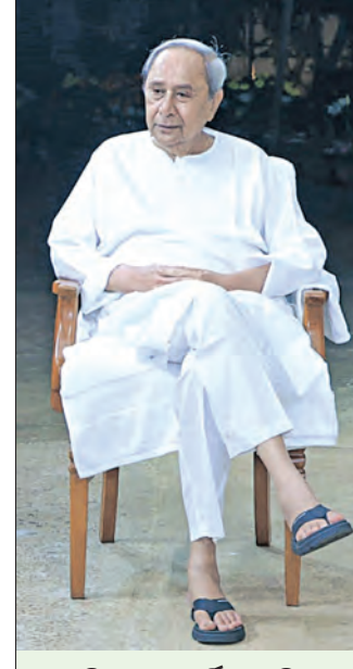
'୫-ଟି' ଅଧ୍ୟକ୍ଷ କାର୍ଯ୍ୟକ୍ରମ ପାଇଁ ଆନନ୍ଦ ପ୍ରକାଶ ଉପସ୍ଥିତ ସାଂସଦ, ବିଧାନସଭା, ଲିଜା ସଭାପତି, ଧର୍ମାଧିକାରୀଙ୍କ ସହ ବରିଷ୍ଠ ନେତା ସାମିଲ

■ ଭୁବନେଶ୍ୱର, ୨୧ ମାର୍ଚ୍ଚ (ଏକେପ୍ରି): ଆଗାମୀ ଲୋକସଭା ଓ ବିଧାନସଭା ନିର୍ବାଚନ ନିମନ୍ତେ ବିକେନ୍ଦ୍ରୀୟ ଭାବେ ପୂର୍ବରୁ ପ୍ରସ୍ତୁତି ଆରମ୍ଭ କରି ସାରିଛି । ଦଳର ଲିଜା, ବୁକ୍, ପଞ୍ଚାୟତ ସଭାପତି ତଥା ଦଳୀୟ ଧର୍ମାଧିକାରୀମାନେ ନିଜ ନିଜ କାର୍ଯ୍ୟରେ ଲାଗି ପଡ଼ିଛନ୍ତି । ଏହି କ୍ରମରେ ଦଳର ସଭାପତି ତଥା ମୁଖ୍ୟମନ୍ତ୍ରୀ ନବୀନ ପଟ୍ଟନାୟକ ବିଭିନ୍ନ ଲୋକସଭା ଓ ବିଧାନସଭା ନିର୍ବାଚନମଣ୍ଡଳରେ ନିର୍ବାଚନ ପ୍ରସ୍ତୁତିର ତନ୍ତନ୍ତ ସମାକ୍ଷା କରୁଛନ୍ତି । ଏହି କ୍ରମରେ ଶୁକ୍ରବାର ୪ଟି ଧର୍ମାଧିକାର ବୁକ୍‌ପୁର, ଆସା, ଭୁବନେଶ୍ୱର ଓ କନ୍ଧମାଳ ଲୋକସଭା କ୍ଷେତ୍ର, ଏହା ଅନ୍ତର୍ଗତ ୨୮ ବିଧାନସଭା ଆସନରେ ନିର୍ବାଚନ ପ୍ରସ୍ତୁତିର ଅନୁଧ୍ୟାନ କରିଛନ୍ତି ଦଳର ସଭାପତି ତଥା ମୁଖ୍ୟମନ୍ତ୍ରୀ ନବୀନ ପଟ୍ଟନାୟକ । ଆଜିର ୪ ଲୋକସଭା ଆସନକୁ ମିଶାଇ ୩ ଦିନରେ ୮ ଲୋକସଭା ଓ ୫୬ ବିଧାନସଭା କ୍ଷେତ୍ରର ସମାକ୍ଷା କରିଛନ୍ତି ମୁଖ୍ୟମନ୍ତ୍ରୀ ।