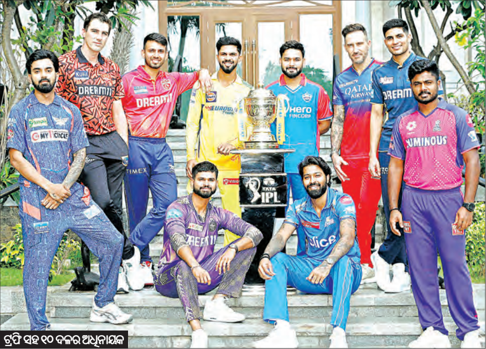
ଚୁପ୍ତି ସହ ୧୦ ଦଳର ଅଧିନାୟକ

ଅନ୍ତର୍ଜାତୀୟ କ୍ରିକେଟର ଦୁଇମାସ ବିଶ୍ରାମ ନେବା ପରେ କୋହଲି ପ୍ରତ୍ୟାବର୍ତ୍ତନ କରିବାକୁ ଯାଉଛନ୍ତି। କିଛି ଦିନ ତଳେ ଅନୁଷ୍ଠିତ ଜଳଖି ବିପକ୍ଷ ୫ ମ୍ୟାଚ୍ ବିଶିଷ୍ଟ ଟେଷ୍ଟ ସିରିଜ୍ ମଧ୍ୟ ସେ ଖେଳି ନଥିଲେ। ଏହି ସମୟରେ ସେ ଦ୍ୱିତୀୟ ତଥା ପୁତ୍ର ସନ୍ତାନର ଜନ୍ମ ହେବାର ସୌଭାଗ୍ୟ ଲାଭ କରିଥିଲେ। ଅନ୍ୟପଟେ ଏହି ସଂସ୍କରଣର ଶ୍ରେଷ୍ଠ ଅବସର ନେବେ ବୋଲି ଧୋନି ପୂର୍ବରୁ ଘୋଷଣା କରିସାରିଛନ୍ତି। ଚେନ୍ନାଇ ସେ ଅଧିକ ଆଇପିଏଲ୍ ମ୍ୟାଚ୍ ଖେଳିବାକୁ ପ୍ରସ୍ତାବ ଦେଇଛନ୍ତି। ଗତ ସଂସ୍କରଣରେ ଚେନ୍ନାଇ ଟାଇଟାନସ୍ କିରିଥିଲା। ଏପର୍ଯ୍ୟନ୍ତ ବେଙ୍ଗାଲୁରୁ ଟାଇଟାନସ୍ ହାସଲ କରିପାରିନାହିଁ। ଚେନ୍ନାଇ ଦଳ ବିଜୟରୁ ଅଭିଯାନ ଆରମ୍ଭ କରିବାକୁ ଚେଷ୍ଟା କରିବେ। ଘରୋଇ ମାଟିରେ ଚେନ୍ନାଇ ରେକର୍ଡ୍ ଜବରଦସ୍ତ ରହିଛି। ଚେନ୍ନାଇ ଚେନ୍ନାଇ ଟାଇଟାନସ୍ ସମ୍ମୁଖୀନ ହେବ। ଏଠାରେ ଚେନ୍ନାଇ ୪୪ଟି ମ୍ୟାଚ୍ ଖେଳି ୪୫ଟିରେ ବିଜୟ ହୋଇଥିବା ବେଳେ ୧୯ଟିରେ ପରାସ୍ତ ହୋଇଛି। ଘରୋଇ ମାଟିରେ ଚେନ୍ନାଇର ବିଜୟ ପ୍ରତିଶତ ୬୦ରୁ ଅଧିକ ରହିଛି। ତେଣୁ ଉଭୟ ଟୀମ୍ ଆରସିବିର ସମସ୍ୟା ରହିଛି। ସିନିଗୁଲ ବିପକ୍ଷରେ ଚେନ୍ନାଇ ବେଶ୍ ଭଲ ଖେଳିଥାଏ। ଅନ୍ୟପଟେ ବେଙ୍ଗାଲୁରୁ ସିନିଗୁଲ ବିରାଗରେ ଦୁର୍ବଳ ରହିଛି। ମଧୁସୂଦନ ପଥରୀ ନ ଥିବାରୁ ଚେନ୍ନାଇ ପାଇଁ ସାମାନ୍ୟ ସମସ୍ୟା ରହିଛି।