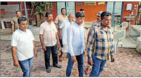
ପ୍ରମାଣ ଅଭାବରୁ ୩ ବୋହୂ ନିର୍ଦୋଷରେ ଖଲାସ