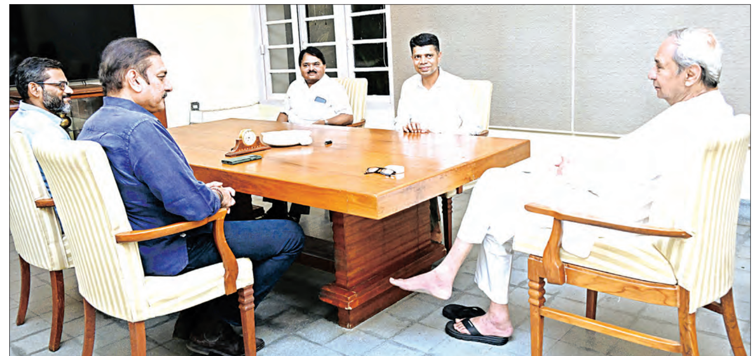
ପୁଣ୍ୟମନ୍ଦିର ନବୀନ ପଠନାୟକଙ୍କ ସହ ଏଫ୍‌୮୩ ଦିନିକିଆ ବିଶ୍ୱକପ୍ ଚାମ୍ପିୟନ୍ ଭାରତୀୟ ଦଳର ସଭ୍ୟ ତଥା ପୂର୍ବତନ ପ୍ରଶିକ୍ଷକ ରବି ଶାସ୍ତ୍ରୀ ହୁଏସ୍‌ଆଇ ସୌଧାଗାମୀଙ୍କୁ ସାକ୍ଷାତ କରି ରାଜ୍ୟରେ କ୍ରୀଡ଼ା ଉନ୍ନତି ସମ୍ପର୍କରେ ଆଲୋଚନା କରୁଛନ୍ତି। ଏହି ଅବସରରେ ୫-ଟି ଅଧ୍ୟକ୍ଷ କାରିକ ପାଠ୍ୟାଳୟ ଓ ଅନ୍ୟାନ୍ୟ ଉପସ୍ଥିତ ଅଛନ୍ତି।

ବାସ୍ତବ ହେବେ। ଏହିକ୍ରମରେ ହାସରଜାଙ୍କୁ ବାସ୍‌ଯୋଗ୍ୟ ପରେ ଖିଳାଳୀର ପ୍ରଥମ ବିଚଳିତ ସ୍ୱରୂପ ବ୍ୟକ୍ତିଗତ ବିପକ୍ଷ ୨ ମ୍ୟାଚ୍‌ବିଶିଷ୍ଟ ଚେଷ୍ଟା ଶୁକ୍ରବାରଠାରୁ ଖେଳାଳିଙ୍କୁ ଦେଖିବାକୁ ଗଲେ ଇଂଲଣ୍ଡର 'ଦି ବ୍ଲେଜେଡ୍' ଦ୍ୱିତୀୟ ସ୍ଥାନରେ ରହିଛି। ସେହିପରି ଦକ୍ଷିଣ ଆଫ୍ରିକା ଟି-୨୦ ଲିଗ୍ (ଏସ୍ୱଏ୨୦) ତୃତୀୟ, କ୍ୟାରିବିୟାନ ପ୍ରିମିୟର ଲିଗ୍ (ସିପିଏଲ୍) ଚତୁର୍ଥ, ପିଏସ୍ଏଲ୍ ୫ମ ସ୍ଥାନରେ ରହିଛି। ପିଏସ୍ଏଲର ବ୍ରାଣ୍ଡ ଭାଲ୍ୟୁ ୨୪.୮୬ କୋଟି ଟଙ୍କା ରହିଛି। ୨୦୦୮ ପ୍ରଥମ ସଂସ୍କରଣରେ ଆଇପିଏଲର ବ୍ରାଣ୍ଡ ଭାଲ୍ୟୁ ୨୦୨୩ରେ ବ୍ରାଣ୍ଡ ଭାଲ୍ୟୁ ୪୩୩୩ ପ୍ରତିଶତ ଅଧିକ।