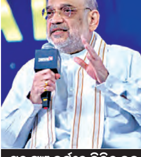
ଗତ ପାଞ୍ଚ ବର୍ଷରେ ବିଭିନ୍ନ ଦଳ ଦେଇଛନ୍ତି ପ୍ରସଙ୍ଗ ଭିତ୍ତିକ ସମର୍ଥନ