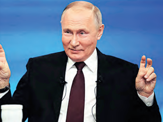
ତୈକ ରାଜନୀତି ଏକବିଂଶ ଶତାବ୍ଦୀର ପ୍ରାରମ୍ଭରେ ବିଜ୍ଞାନ ଓ ବୈଷୟିକ କ୍ଷେତ୍ରର ଦ୍ରୁତ ବିକାଶ ସହିତ ଯେଉଁକ୍ଷେତ୍ରରେ ସମୁଦ୍ର ବଡ଼ ଆହୁନ ସୃଷ୍ଟି ହୋଇଥିଲା...