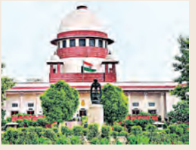
ସିଏଏକୁ ବିରୋଧ କରି ସର୍ବୋଚ୍ଚ ନ୍ୟାୟାଳୟରେ ୨୩୭ଟି ପିଟିସନ କେନ୍ଦ୍ରକୁ ନୋଟିସ୍ ଜାରି; ଏପ୍ରିଲ ୯ରେ ପରବର୍ତ୍ତୀ ଶୁଣାଣି

■ ଦୁଆବିଲ୍ଲା, ୧୯।୩ (ଏକେଡ଼ି): ନାଗରିକତା ସଂଶୋଧନ ଆଇନ (ସିଏଏ) ଏବଂ ଏହାର ନିୟମାବଳୀର କାର୍ଯ୍ୟକାରୀତା ଉପରେ ରୋକ୍ ଲଗାଇବାକୁ ସୁପ୍ରିମକୋର୍ଟ ଅଗ୍ରାହ୍ୟ କରିଦେଇଛନ୍ତି। ସାରା ଦେଶରେ ସିଏଏ ଲାଗୁ ହେବା ପରେ ଏହାକୁ ବିଭିନ୍ନ ସ୍ତରରେ ବିରୋଧ କରାଯାଇ ଏହା ଉପରେ ରୋକ୍ ଲଗାଇବାକୁ ଉଦ୍ୟମ କରାଯାଇଥିଲା। ଏହିକ୍ରମରେ ସୁପ୍ରିମକୋର୍ଟରେ ୨୩୭ଟି ପିଟିସନ ଦାଏର ହୋଇଥିଲା ବେଳେ ଏଥିମଧ୍ୟରୁ ୨୦ଟି ରୁ ଅଧିକ ଆବେଦନରେ ତୁରନ୍ତ ସିଏଏର କାର୍ଯ୍ୟକାରୀତା ଉପରେ ରୋକ୍ ଲଗାଇବାକୁ ସର୍ବୋଚ୍ଚ ନ୍ୟାୟାଳୟକୁ ନିବେଦନ କରାଯାଇଥିଲା। କିନ୍ତୁ ଏହି ପ୍ରସଙ୍ଗରେ ସୁପ୍ରିମକୋର୍ଟ ମଙ୍ଗଳବାର ଶୁଣାଣି କରି ସିଏଏ ଉପରେ ରୋକ୍ ଲଗାଇବାକୁ ମନା କରିଦେଇଛନ୍ତି।