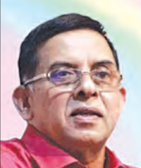
ବିଜ୍ଞପ୍ତିରେ କୁହାଯାଇଛି। ପ୍ରତିବର୍ଷ ନୂଆଦିଲ୍ଲୀରୁ କେ.କେ. ବିର୍ଲା ଫାଉଣ୍ଡେସନ୍ ପକ୍ଷରୁ ଭାରତୀୟ ଭାଷାର ଜଣେ ସାହିତ୍ୟିକଙ୍କ ଏକ ଉଚ୍ଚକୋଟୀର କୃତିକୁ ସରସ୍ୱତୀ ସମ୍ମାନ ପ୍ରଦାନ କରାଯାଇଥାଏ। ୨୦୨୩ ମସିହା ନିମନ୍ତେ ୧୩ସଦସ୍ୟ ବିଶିଷ୍ଟ ମନୋନୟନ କମିଟି ପ୍ରଭା ବର୍ମାଙ୍କ 'ଗୌତ୍ୱ ସାହିତ୍ୟ' ପୁସ୍ତକକୁ ଏହି ସମ୍ମାନ ପାଇବା ପାଇଁ ଚୟନ କରିଛନ୍ତି। ଏହା ଏକ ଆଧୁନିକ ମହାକାବ୍ୟ। ୨୦୨୨ ମସିହାରେ ପ୍ରକାଶିତ ଏହି କବିତା ଗ୍ରନ୍ଥରେ ରାଜନୀତି ଓ କ୍ଷମତା, ବ୍ୟକ୍ତି ଓ ପାଠକଙ୍କ ସହ ପଞ୍ଚମ ପ୍ରକାଶିତ ଏକ ପ୍ରେସ୍

■ ଭୁବନେଶ୍ୱର, ୧୯।୩ (ସମ୍ପାଦକ): ୨୦୨୩ ମସିହା ପାଇଁ ପ୍ରସିଦ୍ଧ ମାଲାୟାଲମ୍ କବି ପ୍ରଭା ବର୍ମା ପାଇବେ ମର୍ଯ୍ୟାଦାଜନକ ସରସ୍ୱତୀ ସମ୍ମାନ। ମାଲାୟାଲମ୍ ଭାଷାରେ ରଚିତ କବିତା ଗ୍ରନ୍ଥ 'ଗୌତ୍ୱ ସାହିତ୍ୟ' ଏବଂ ୨୦୧୩ରୁ ୨୦୨୨ ମସିହା ମଧ୍ୟରେ ସାହିତ୍ୟ ଜଗତକୁ ଉଲ୍ଲେଖନୀୟ ଅବଦାନ ପାଇଁ ସେ ଏହି ସମ୍ମାନ ପାଇବା ନିମନ୍ତେ ମନୋନୀତ ହୋଇଛନ୍ତି। ଏ ବାବଦରେ ତାଙ୍କୁ ପ୍ରଶଂସାପତ୍ର, ପତକ ଓ ୧୫ଲକ୍ଷ ଟଙ୍କାର ପୁରସ୍କାର ରାଶି ପ୍ରଦାନ କରାଯିବ ବୋଲି କେ.କେ. ବିର୍ଲା କବିତା ଗ୍ରନ୍ଥରେ ରାଜନୀତି ଓ କ୍ଷମତା, ବ୍ୟକ୍ତି ଓ ପାଠକଙ୍କ ସହ ପଞ୍ଚମ ପ୍ରକାଶିତ ଏକ ପ୍ରେସ୍