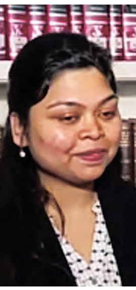
ଆମେରିକାରେ ୨ଟି ସ୍କୁଲରୁ ପାଇବା ପାଇଁ ଆପଣ ଯୋଗ୍ୟ ବିବେଚିତ ହୋଇଛନ୍ତି, କେତେ ସଂପର୍କ ଥିଲା ଏ ଯାତ୍ରା?

ରହି ପୁଁ ବଢ଼ିଛି ବିଦ୍ୟାଳୟଠାରୁ କଲେଜ ଶିକ୍ଷା ସବୁକିଛି ମୋର ଏଠି । ବାପାଙ୍କ ପ୍ରେରଣା ମତେ ଆଜି ଏଠି ଆଣି ପହଞ୍ଚାଇ ପାରିଛି । ବାପା ସବୁବେଳେ ମୋର ସପୋର୍ଟ ସିଏମ୍ ହୋଇ ରହି ଆସିଛନ୍ତି । ପାଠପଢ଼ାରେ ସେଥିପାଇଁ କେବେ ବି ଅସୁବିଧା ହୋଇନାହିଁ ।