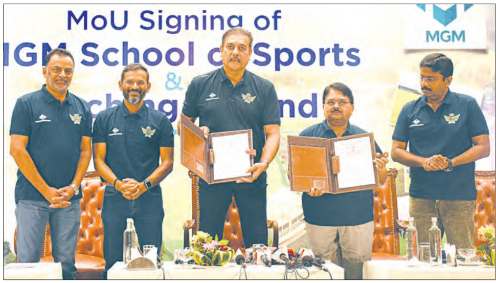
ସହାୟତା ନେଇଛି ଓ ତାଙ୍କ ସହ ରୁକ୍ତି କରିଛି । ପ୍ରଥମେ ୫୦ଜଣ କ୍ରିକେଟରଙ୍କୁ ସ୍ୱଳ୍ପ ପ୍ରଶିକ୍ଷଣରେ ନିଯୋଗ କରାଯିବ । ଭବିଷ୍ୟତରେ ପୁରୁଷଙ୍କ ସମେତ ମହିଳା କ୍ରିକେଟରମାନଙ୍କୁ ମଧ୍ୟ ଏହି ପ୍ରଶିକ୍ଷଣ ଦେବା ଉପଲବ୍ଧ କରାଯିବ । ଏହି ସହକାରୀତା ଓଡ଼ିଆ କ୍ରିକେଟର ଭବିଷ୍ୟତକୁ ସମୃଦ୍ଧ କରିବ ଓ କେବଳ ରାଜ୍ୟ କିମ୍ବା ଦେଶ ନୁହଁ ବିଦେଶରେ ଏହା ଏକ ସମ୍ମାନଜନକ କ୍ରିକେଟ ଚାଳନା କେନ୍ଦ୍ରରେ ପରିଣତ ହେବ ବୋଲି ପକ୍ଷ କହିଛନ୍ତି ।

କଟକ ସହର ନିକଟସ୍ଥ ଆଠଗଡ଼ ସବଡିଭିଜନରେ ଥିବା କପୁରଝିର ଗୁରୁତିଆରୀୟାଠାରେ ଥିବା ରାଜ୍ୟର ଅନ୍ୟତମ ଅଗ୍ରଣୀ କ୍ରୀଡ଼ା ଏକାଡେମୀ ଏମ୍‌ଜିଏମ୍ ସ୍କୁଲ ଅଫ୍ ସ୍ପୋର୍ଟ୍ସ ଏବେ ନୂଆ ରୂପ ନେବାକୁ ଯାଉଛି । ଏଠାରେ ଥିବା ଉଚ୍ଚକୋଟୀର କ୍ରିକେଟ ଏକାଡେମୀରେ ବିଶିଷ୍ଟ ଓଡ଼ିଆ ପ୍ରଶିକ୍ଷକଙ୍କୁ ଉପଲବ୍ଧ ହେବ । ଏଥିପାଇଁ ଏ ନେଇ ଏଠାରେ ଆୟୋଜିତ ଏକ ସତର୍କ କାର୍ଯ୍ୟକ୍ରମରେ ଏମ୍‌ଜିଏମ୍ ସ୍କୁଲ ଅଫ୍ ସ୍ପୋର୍ଟ୍ସ ପୂର୍ବତନ କ୍ରିକେଟର ରବି ଶାସ୍ତ୍ରୀଙ୍କ ସହ ଓଡ଼ିଆ ପ୍ରଶିକ୍ଷକଙ୍କୁ ଏକାଡେମୀ ସହ ବୁଝାମଣା ପଥ ସ୍ପଷ୍ଟ କରିଛି । କୋଟି ବିରକ୍ଷିତ ଏକାଡେମୀ ସହ ବୁଝାମଣା ପଥ ସ୍ପଷ୍ଟ କରିଛି । କୋଟି ବିରକ୍ଷିତ ଏକାଡେମୀ ସହ ବୁଝାମଣା ପଥ ସ୍ପଷ୍ଟ କରିଛି । କୋଟି ବିରକ୍ଷିତ ଏକାଡେମୀ ସହ ବୁଝାମଣା ପଥ ସ୍ପଷ୍ଟ କରିଛି ।