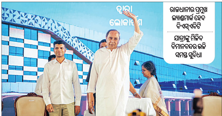
ରାଜଧାନୀର ପ୍ରମୁଖ ଲ୍ୟାଣ୍ଡମାର୍କ ହେବ ବିଏସ୍ଏସିଟି ଯାତ୍ରାକୁ ମିଳିବ ବିମାନବନ୍ଦର ଭଳି ସମସ୍ତ ସୁବିଧା

■ ଭୁବନେଶ୍ୱର, ୧୩ (ସମ୍ପାଦକ): ବାହର ରୂପ ନେଇଛି ରାଜଧାନୀର ସ୍ୱରୂପ। 'ନବୀନ ଓଡ଼ିଶା'ର ନୂଆ ପ୍ରତୀକ ଭାବରେ ଆନ୍ତର୍ଜାତୀୟ ବରମୁଣ୍ଡା ବସ୍ ଟର୍ମିନାଲକୁ ମୁଖ୍ୟମନ୍ତ୍ରୀ ନବୀନ ପଟ୍ଟନାୟକ ଉଦ୍ଘାଟନ କରିଛନ୍ତି। ରାଜ୍ୟ ଓ ରାଜ୍ୟ ବାହାରକୁ ଗମନାଗମନରେ ଏହା ଏକ ନୂତନ ମାଇଲଖୁଣ୍ଟି ହୋଇଛି। ଶୁକ୍ରବାର ସନ୍ଧ୍ୟାରେ '୫-ଟି' ଉପକ୍ରମରେ ନବନିର୍ମିତ ଏହି ବସ୍ ଟର୍ମିନାଲରୁ ବିଧିବଦ୍ଧ ଭାବରେ ବସ୍ ଚଳାଚଳକୁ ଶୁଭାରମ୍ଭ କରିଛନ୍ତି ମୁଖ୍ୟମନ୍ତ୍ରୀ। ଏହି ଅବସରରେ ମୁଖ୍ୟମନ୍ତ୍ରୀ କହିଛନ୍ତି ଯେ ଏହି ବସ୍ ଟର୍ମିନାଲରେ ଯାତ୍ରାକ ପାଇଁ ବିମାନବନ୍ଦର ଭଳି ସୁବିଧାସୁଯୋଗ ରହିଛି। ଏହା