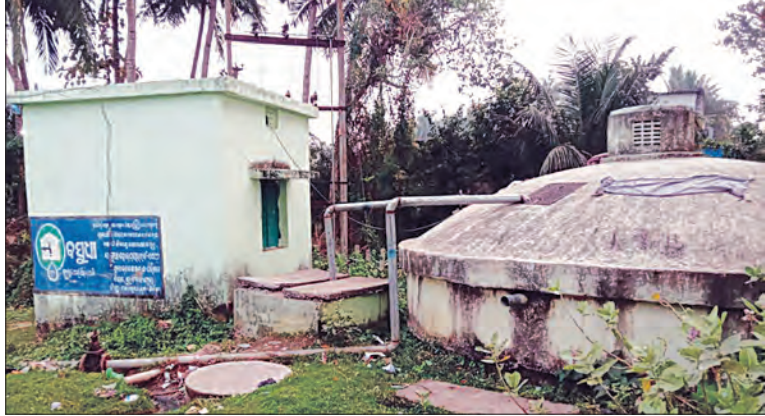
ଚନ୍ଦ୍ରାପୁର ଚଣା ଅଠରବୀଟିଆ, ଛେଡ଼ାପଦର, ଛଟନପୁର, ଭେଲୋରା, ଗବପଦର ଓ ହଜାର ଜନସାଧାରଣ ବାସ କରନ୍ତି। ବାଲୁଗା ଜଳନପୁର, ଭେଲୋରା, ଗବପଦର ଓ କ୍ଷୁଦ୍ର ସହରକୁ ଅଠରବୀଟିଆ ପଞ୍ଚାୟତ ରାସ୍ତା ଦେଇ ପାଇପ୍ ଯୋଗେ ପାନୀୟ ଜଳ ଯୋଗାଇ ଦିଆଯାଉଥିବା ଅତି ଛଅ ଖଣ୍ଡ ଗ୍ରାମର ପ୍ରାୟ ୧୦

କେନ୍ଦ୍ର ଓ ରାଜ୍ୟ ସରକାର ଲୋକଙ୍କୁ ପାନୀୟ ଜଳ ଯୋଗାଇ ଉପରେ ଗୁରୁତ୍ୱ ଦେଇ ଏଥି ନିମନ୍ତେ କୋଟି କୋଟି ଟଙ୍କା ବିନିଯୋଗ କରୁଛନ୍ତି। ସରକାରଙ୍କ ତରଫରୁ ପ୍ରତ୍ୟେକ ଗ୍ରାମରେ ଘରକୁ ଘର ପାଇପ ବିଛାଇ ପାନୀୟ ଜଳ ଯୋଗାଇ ଦେବା ଲାଗି ଷଡ଼ତ ଡାକ୍ତରୀ ଯୋଜନା କରାଯାଇଅଛି। ତେବେ ବିଭାଗୀୟ କର୍ତ୍ତୃପକ୍ଷଙ୍କ ଅବହେଳା ଯୋଗୁଁ ଏହି ଯୋଜନା ଅନେକ ପଞ୍ଚାୟତରେ ବିପଦ ହୋଇଥିବାର ଦେଖିବାକୁ ମିଳିଛି। ଖୋର୍ଦ୍ଧା ଜିଲ୍ଲାର ତିଲିକା ବ୍ଲକ ଅନ୍ତର୍ଗତ ଅଠରବୀଟିଆ ପଞ୍ଚାୟତରେ ଯୋଜନା ବାମନେଣା ହୋଇଥିବା ଦେଖାଦେଇଛି।