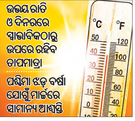
ଉତ୍ତମ ରାତି ଓ ଦିନରେ ସାଭାବିକଠାରୁ ଉପରେ ରହିବ ତାପମାତ୍ରା ପଶିମା ଝଡ଼ ବର୍ଷା ଯୋଗୁଁ ମାର୍ଚ୍ଚରେ ସାମାନ୍ୟ ଆଖି