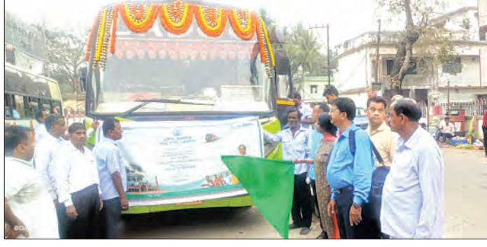
ସେମାନଙ୍କୁ ଆଜି ବାଲେଶ୍ଵର ନିଆଯାଇଛି। ତୀର୍ଥଯାତ୍ରାଙ୍କ ରାତ୍ରି ରହଣା, ଖାଦ୍ୟପେୟର ବ୍ୟବସ୍ଥା ବାଲେଶ୍ଵର ଜିଲ୍ଲା ପ୍ରଶାସନ ଓ

ଆଜି ୧୭୮ ଜଣ ତୀର୍ଥଯାତ୍ରାଙ୍କ ଜିଲ୍ଲା ମୁଖ୍ୟ ଚିକିତ୍ସାଳୟରେ ମେଡିକାଲ ଅଧିକାରୀ ଦ୍ଵାରା ସାମ୍ବ୍ୟ ପରୀକ୍ଷା କରାଯିବ। ସହ ସେମାନଙ୍କ ପାଇଁ ଖାଦ୍ୟପେୟର ବ୍ୟବସ୍ଥା କରାଯାଇଥିଲା। ପାଞ୍ଚୋଟି ବସରେ