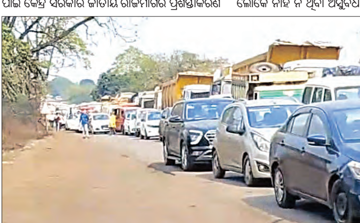
ଝାରସୁଗୁଡ଼ା, ୧୨୩(ସମ୍ପାଦକ): ଝାରସୁଗୁଡ଼ାରୁ ବେଲପାହାଡ଼ର ଦୂରତ୍ୱ ମାତ୍ର କୋଡିଏ କିଲୋମିଟର। କିନ୍ତୁ ଏହି ରାସ୍ତା ଅତିକ୍ରମ କରିବା ପାଇଁ ଲାଗୁଛି ଦୁଇ ଘଣ୍ଟାରୁ ଅଧିକ ସମୟ।

ଝାରସୁଗୁଡ଼ା, ୧୨୩(ସମ୍ପାଦକ): ଝାରସୁଗୁଡ଼ାରୁ ବେଲପାହାଡ଼ର ଦୂରତ୍ୱ ମାତ୍ର କୋଡିଏ କିଲୋମିଟର। କିନ୍ତୁ ଏହି ରାସ୍ତା ଅତିକ୍ରମ କରିବା ପାଇଁ ଲାଗୁଛି ଦୁଇ ଘଣ୍ଟାରୁ ଅଧିକ ସମୟ। ସାଧାରଣ ଯାନାଚରଣ ପାଇଁ କେନ୍ଦ୍ର ସରକାର ଜାତୀୟ ରାଜମାର୍ଗ ପ୍ରଶସ୍ତାପନ କରିବା ପାଇଁ ଲକ୍ଷ୍ୟ ରଖିଛନ୍ତି।