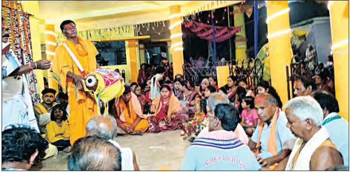
ଝାରସୁଗୁଡ଼ା, ୧୨୩(ସମ୍ପାଦକ): ଝାରସୁଗୁଡ଼ା ଜିଲ୍ଲାର ବ୍ରଜରାଜନଗର ପୌର ପରିଷଦ ଅନ୍ତର୍ଗତ ୩୯ ନଂ ୨୨ ନୂଆଡ଼ିହି ଗ୍ରାମରେ ଅନୁଷ୍ଠିତ ଚରିଣ ପ୍ରହର ନାମାୟା ଉଦ୍‌ଯାପିତ ହୋଇଯାଇଛି।

ବ୍ରଜରାଜନଗର, ୧୨୩(ସମ୍ପାଦକ): ଝାରସୁଗୁଡ଼ା ଜିଲ୍ଲାର ବ୍ରଜରାଜନଗର ପୌର ପରିଷଦ ଅନ୍ତର୍ଗତ ୩୯ ନଂ ୨୨ ନୂଆଡ଼ିହି ଗ୍ରାମରେ ଅନୁଷ୍ଠିତ ଚରିଣ ପ୍ରହର ନାମାୟା ଉଦ୍‌ଯାପିତ ହୋଇଯାଇଛି।