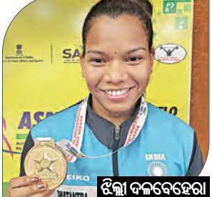
ଭୁବନେଶ୍ୱର, ୧୭ ମାର୍ଚ୍ଚ (ସମ୍ପାଦକ)

ହିମାଚଳ ପ୍ରଦେଶର କାମ୍ପା ଲିଭାରେ ଚାଲିଥିବା ଖେଳୋ ଇଣ୍ଡିଆ ମହିଳା ଭାରୋଭୋଜନ ଲିଗ୍‌ରେ ଓଡ଼ିଆ ପ୍ରତିଯୋଗୀଙ୍କୁ ରବିବାର ୪ଟି ପଦକ ସଫଳତା ମିଳିଛି। ଯେଉଁଥିରେ ୨ଟି ସର୍ବ ଏବଂ