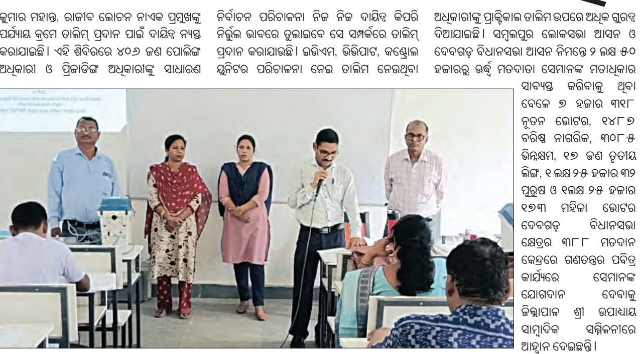
ଝାରସୁଗୁଡ଼ା, ୧୨୩(ସମ୍ପାଦକ): ଦେବଗଡ଼ ଜିଲ୍ଲା ପ୍ରଶାସନ ପକ୍ଷରୁ ସମସ୍ତ ପ୍ରସ୍ତୁତି ଆରମ୍ଭ କରାଯାଇଛି। ମଇ ୨୫ତାରିଖ ଦିନ ହେବାକୁ ଥିବା ବିଧାନସଭା ଓ ଲୋକସଭା ନିର୍ବାଚନ ପାଇଁ ମତଦାନ ପ୍ରକ୍ରିୟା ସରଳ ଓ ତୁରନ୍ତଗତ୍ୟ କରିବା ପାଇଁ ନିୟୁତ୍ତ ପୋଲିଙ୍ଗ ଅଧିକାରୀଙ୍କ ପ୍ରଶିକ୍ଷଣ ଶିବିର ଆରମ୍ଭ ହୋଇଛି।

ଦେବଗଡ଼, ୧୨୩(ସମ୍ପାଦକ): ଆସନ୍ତା ସାଧାରଣ ନିର୍ବାଚନ ପାଇଁ ଦେବଗଡ଼ ଜିଲ୍ଲା ପ୍ରଶାସନ ପକ୍ଷରୁ ସମସ୍ତ ପ୍ରସ୍ତୁତି ଆରମ୍ଭ କରାଯାଇଛି। ମଇ ୨୫ତାରିଖ ଦିନ ହେବାକୁ ଥିବା ବିଧାନସଭା ଓ ଲୋକସଭା ନିର୍ବାଚନ ପାଇଁ ମତଦାନ ପ୍ରକ୍ରିୟା ସରଳ ଓ ତୁରନ୍ତଗତ୍ୟ କରିବା ପାଇଁ ନିୟୁତ୍ତ ପୋଲିଙ୍ଗ ଅଧିକାରୀଙ୍କ ପ୍ରଶିକ୍ଷଣ ଶିବିର ଆରମ୍ଭ ହୋଇଛି।