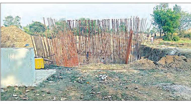
କଣ୍ଟାମାଳ ରୁକ୍ ପାଳସାଗୋରୀ ପଞ୍ଚାୟତ ଦପତ୍ତା ପ୍ରଧାନମନ୍ତ୍ରୀ ଗ୍ରାମ ସଡ଼କଠାରୁ ଗୁଆବାହାଲ ଫେରିଯାଏ ପର୍ଯ୍ୟନ୍ତ ଯାଇଥିବା ରାସ୍ତାର ଗୁଆବାହାଲ ନାକରେ କିଲ୍ଲା ଗ୍ରାମ୍ୟ

ଶରଡ଼ା, ୧୫ମାର୍ଚ୍ଚ(ସମିଧ): ସରକାର ଗମନାଗମନ କ୍ଷେତ୍ରରେ ଉନ୍ନତି ଆଣିବା ପାଇଁ ଅନେକ ଯୋଜନା ପ୍ରଣୟନ କରି ବାର୍ଷିକ କୋଟି କୋଟି ଟଙ୍କା ଖର୍ଚ୍ଚ କରୁଛନ୍ତି । ଅନେକ ରାସ୍ତାରେ ସୁରକ୍ଷା ସେତୁ ନିର୍ମାଣ କରି କୋଟି କୋଟି ଟଙ୍କା ଖର୍ଚ୍ଚ କରୁଛନ୍ତି; ହେଲେ ବିଭାଗୀୟ ଅଧିକାରୀଙ୍କ ଦୂରଦୃଷ୍ଟିର ଅଭାବ ସାଙ୍ଗକୁ ଲାଭଖୋର ମନିବୁଡି ଯୋଗୁଁ ଯୋଜନାର ଠିକ ରୂପାୟନ ହେଉ ନ ଥିବା ବେଳେ ଜନସାଧାରଣ ଏହାର ସୁବିଧାକୁ ବଞ୍ଚିତ ହେଉଛନ୍ତି । ସ୍ଥାନୀୟ ଲୋକଙ୍କ ସୁବିଧା ଅପେକ୍ଷା ଠିକାଦାର ପୋଷା ନୀତିରେ ଚାଲିଛି ସେତୁ କାମ ।