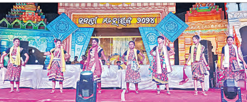
ସମ୍ବାର୍ଦ୍ଧନ ସମେତ ଅନେକ ସଂସ୍କୃତିକ କଳା ମୁଖ୍ୟ ଅତିଥି ଓ ଅନ୍ୟାନ୍ୟ ସିନାପାଲି ସହର ପରିକ୍ରମା କରିଥିଲା ।