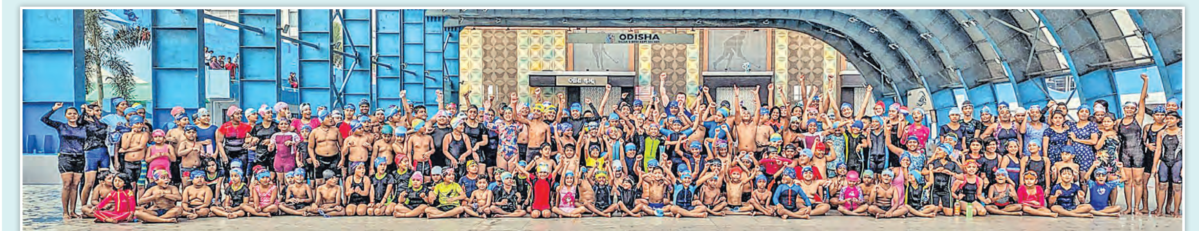
ଭୁବନେଶ୍ୱର କଳିଙ୍ଗ ଷ୍ଟାଡ଼ିୟମରେ ୫ ଦିନ ଧରି ଚାଲିଥିବା ଏସିଏ ଅନ୍ତର୍ଜାତୀୟ ସନ୍ତରଣ ଶିକ୍ଷକ ପ୍ରମାଣପତ୍ର କାର୍ଯ୍ୟକ୍ରମ ଶୁକ୍ରବାର ସଫଳତାର ସହ ଶେଷ ହୋଇଛି । ଏଥିରେ ରାଜ୍ୟର ୨୪ ଜଣ ମହିଳା ସନ୍ତରଣ ପ୍ରଶିକ୍ଷକ ସହ ୧୫୦ରୁ ଊର୍ଦ୍ଧ୍ୱ ଛାତ୍ରଛାତ୍ରୀ ଭାଗନେଇଥିଲେ ।