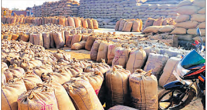
କିଲୋଗ୍ରାମ ଧାନ କ୍ରୟ ହୋଇଥିଲା। ସେଥିପାଇଁ ସରକାରଙ୍କ ନିର୍ଦ୍ଧାରିତ କିଣ୍ଡାଲ ୧୨ ଲକ୍ଷ ୯୫ହଜାର ୩୩୪୭୦ କିଣ୍ଡାଲ ୯୦ ପ୍ରାୟ ଧାନ କ୍ରୟ ହୋଇଥିଲା।

ଜୟପୁର, ୧୪ମାର୍ଚ୍ଚ(ସମ୍ପାଦକ): କୋରାପୁଟ ଜିଲ୍ଲାରେ ଗତ ଖରିଦ ଧାନ କ୍ରୟ ଶେଷ ହୋଇଛି। ଜିଲ୍ଲା ପ୍ରଶାସନ ପକ୍ଷରୁ ଜିଲ୍ଲାରେ ନିଯୁକ୍ତ ୩୩୪୭୦ କ୍ରୟକାରୀଙ୍କୁ ଧାନ କ୍ରୟ କରାଯାଇଛି।