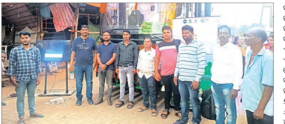
ନବରଙ୍ଗପୁର, ୧୪ମାର୍ଚ୍ଚ(ସମ୍ପାଦକ): ନବରଙ୍ଗପୁର ଜିଲ୍ଲାବାସୀ ତଥା ଜିଲ୍ଲାର ଜଗନ୍ନାଥ ପ୍ରେମୀଙ୍କ ପାଇଁ ଗୁରୁବାରଠାରୁ ଆରମ୍ଭ ହୋଇଛି ଶ୍ରୀକ୍ଷେତ୍ର ପୁରୀକୁ ଆରାମ ଦାୟକ ସ୍ମିପର୍ ଯାତ୍ରା। ଯାତ୍ରା ପରିବହନ କ୍ଷେତ୍ରରେ ଗାନ୍ଧୀ ସରକାର ଗୋଟିଏ ପରେ ଗୋଟିଏ ସୁଯୋଗ ପ୍ରଦାନ କରୁଥିବାବେଳେ ନବରଙ୍ଗପୁର ଜିଲ୍ଲା ସରକାର ମହକୁମାରୁ ଶ୍ରୀଜଗନ୍ନାଥ ଏକ୍ସପ୍ରେସ୍ ଭୋଲ୍ ଭୋ