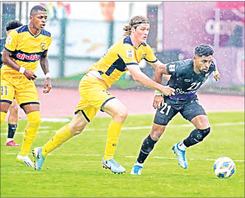
ଭୁବନେଶ୍ୱର, ୧୪ ମାର୍ଚ୍ଚ (ସମ୍ପାଦକ)

ସମ୍ପାନକନକ ପୁରୁଷୋତ୍ତମ ପ୍ରତିଯୋଗିତା ଏଏସ୍‌ସି କପ୍‌ରେ ଓଡ଼ିଶା ପୁରୁଷ ଲୁଗା (ଏଏସ୍‌ସି)ର ଅଭିଯାନ ସେମିଫାଇନାଲରେ ଅଟକିଯାଇଛି। ସ୍ଥାନୀୟ କଳିଙ୍ଗ ଷ୍ଟାଡ଼ିୟମରେ ଗୁରୁବାର ଓଡ଼ିଶା ଏଏସ୍‌ସି ଓ