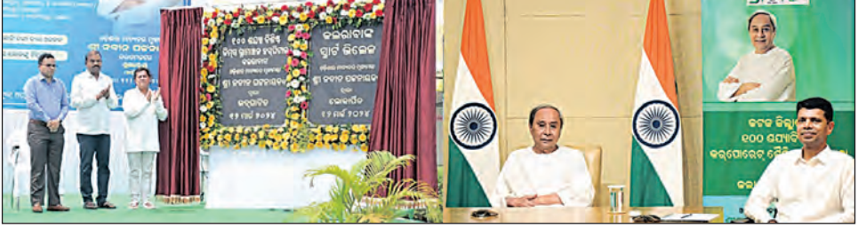
ବିଭିନ୍ନ ଜିଲ୍ଲାରେ ୧୯ଟି କିମ୍ବ ଗ୍ରାମୀଣ ଡାକ୍ତରଖାନାର ଭିତ୍ତିପ୍ରସ୍ତର ସ୍ଥାପନ

ଓ ସ୍ୱାସ୍ଥ୍ୟ ହେଉଛି ସମାଜର ଦୁଇଟି ଅପରିହାର୍ଯ୍ୟ ବିଗା । ମୁଖ୍ୟମନ୍ତ୍ରୀ ଏହି ଦୁଇଟି ବିଗାକୁ ଗୁରୁତ୍ୱର ସହ ନେଇ ଏହାର ବିକାଶ କରିଥାରେ ଶୀର୍ଷରେ ପହଞ୍ଚାଇଛନ୍ତି । ମୁଖ୍ୟମନ୍ତ୍ରୀ ଉଭୟ ସହରାଞ୍ଚଳ ଓ ଗ୍ରାମାଞ୍ଚଳର ଉନ୍ନତିକୁ ସମାନ ଭାବେ ପ୍ରାଧାନ୍ୟ ଦେଇଥାନ୍ତି । ଆଜି କଲରାବାଙ୍କ ଗ୍ରାମରେ ସହର ଭଳି ସମସ୍ତ ସୁବିଧା ଉପଲବ୍ଧ କରାଯାଇଛି । ଆମ ସ୍ୱାସ୍ଥ୍ୟସେବା କ୍ଷେତ୍ରରେ ଏହି ମହତ ଲକ୍ଷ୍ୟ ନେଇ ଆମେ କାମ କରୁଛୁ ଏବଂ ଓଡ଼ିଶାର ସବୁ ପରିବାର ଯେପରି ଉତ୍ତମ ସ୍ୱାସ୍ଥ୍ୟସେବା ପାଇପାରିବେ ତାକୁ ଆମେ ପ୍ରାଧାନ୍ୟ ଦେଇ କାମ କରୁଛୁ ବୋଲି ସେ କହିଥିଲେ । ଏ ଦିଗରେ ଆମ ହର୍ଷପିତା, ବି-ଏସ୍-କେଏଲ, ବି-ଏସ୍-କେଏଲ ନବୀନ କାର୍ଡ ଆଦି ଯୋଜନା କାର୍ଯ୍ୟକାରୀ କରାଯାଇଛି । କିମ୍ବ ପରି ଘରୋଇ ସଂସ୍ଥା ରୁଚିକର ଯୋଗଦାନ ଆମର ସ୍ୱାସ୍ଥ୍ୟସେବା କ୍ଷେତ୍ରକୁ ଆହୁରି