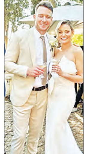
ଦ.ଆପ୍ତିକାର ବିଷ୍ଣୋରକ ବ୍ୟାଟର୍ ଡେବିଡ୍ ମିଲର ଦାସିଦିନ ବାସନ୍ତ କାମିଲା ହରିସକ୍ ସହ ବିବାହ ବନ୍ଧନରେ ଆବଦ୍ଧ ହୋଇଛନ୍ତି।