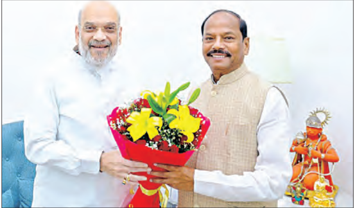
ସୋମବାର ଓଡ଼ିଶା ରାଜ୍ୟପାଳ ରଘୁବର ଦାସ କେନ୍ଦ୍ର ଗୃହମନ୍ତ୍ରୀ ଅମିତ୍ ଶାହାଙ୍କୁ ଭେଟିଛନ୍ତି। ଏ ସମ୍ପର୍କରେ ରାଜ୍ୟପାଳ ନିଜ 'ଏକ୍ସ' ଆକାଉଣ୍ଟରେ ପୂର୍ବନ ଦେଇଛନ୍ତି। ରାଜ୍ୟପାଳ ଏହି ସାକ୍ଷାତକୁ ଯୌଜନମୂଳକ ବୋଲି ଉଲ୍ଲେଖ କରିଛନ୍ତି।

ମହିଳାମାନଙ୍କ ଆର୍ଥିକ ଓ ସାମାଜିକ ସଶକ୍ତିକରଣରେ ଗୁରୁତ୍ୱପୂର୍ଣ୍ଣ ଭୂମିକା ଗ୍ରହଣ କରିଛି। ଏଥିରେ ବିଭିନ୍ନ ଗ୍ରାମପଞ୍ଚାୟତଗୁଡ଼ିକ ଓ ବୁକ୍‌ସ୍ତରାୟ ଫେଡେରେସନ ମାନଙ୍କର ଗୁରୁତ୍ୱପୂର୍ଣ୍ଣ ଭୂମିକା ଗ୍ରହଣ କରିଛନ୍ତି। ସମ୍ପଦସହାୟକ ଗୋଷ୍ଠୀମାନଙ୍କର କାର୍ଯ୍ୟକ୍ରମକୁ କ୍ରୀୟାଶୀଳ କରିବା ଦିଗରେ ଏହି ଫେଡେରେସନମାନଙ୍କର ସହଯୋଗ ଭୂମିକା ରହିଛି। '୫-ଟି' ତଥା 'ନବୀନ ଓଡ଼ିଶା' ଅଧିକାରୀଙ୍କ ପାଣ୍ଡିଆନଙ୍କ ଲିମ୍ବାଗ୍ର ସମୟରେ ବିଭିନ୍ନ ଅଞ୍ଚଳରେ ମିଶନ ଶକ୍ତି ଫେଡେରେସନର କର୍ମକର୍ତ୍ତାମାନେ ସେମାନଙ୍କ ସହଯୋଗ ପରିମାଣ ବୃଦ୍ଧି କରିବା ପାଇଁ ପ୍ରସ୍ତାବ ଦେଇଥିଲେ। ମୁଖ୍ୟମନ୍ତ୍ରୀଙ୍କ ସହ ଏ ବିଷୟରେ ଆଲୋଚନା କରିବା ପରେ ସେମାନଙ୍କ ବୈଠକ ଦେଇ ପରିମାଣ ବୃଦ୍ଧି କରିବା ପାଇଁ ନିଷ୍ପତ୍ତି ନିଆଯାଇଛି। ସମ୍ପଦ ସହାୟକ ସମୁଦାୟ ୨୬୨୬ ଲକ୍ଷ ବୁକ୍‌ସ୍ତରାୟ ଫେଡେରେସନ ସହାୟତା ପ୍ରଦାନ ଓ ସମ୍ପାଦକ ଥିବା ବେଳେ ଅନ୍ୟ ସଦସ୍ୟମାନଙ୍କ ସଂଖ୍ୟା ୩୦୪୨ ରହିଛି। ସେହିପରି ଗ୍ରାମପଞ୍ଚାୟତଗୁଡ଼ିକ ଫେଡେରେସନରେ ୧୩୫୮୮ ଜଣ ସଭାପତି ଓ ସମ୍ପାଦକ ଏବଂ ୧ ଲକ୍ଷ ୮ ହଜାର ୨୦୪ ସଦସ୍ୟ ରହିଛନ୍ତି। ସରକାରଙ୍କ ଏହି ନିଷ୍ପତ୍ତି ଦ୍ୱାରା ସମୁଦାୟ ୧ ଲକ୍ଷ ୨୬ ହଜାର ୧୦ କର୍ମକର୍ତ୍ତା ଉପକୃତ ହେବେ।