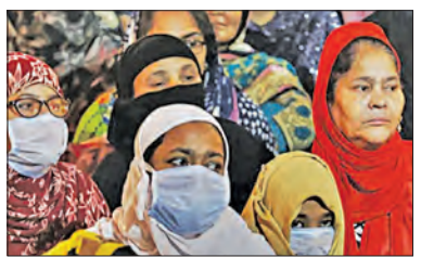
କେବଳ ସିଏଏ ନୁହେଁ, ନ୍ୟାସନାଲ୍ ପର୍ସୋନାଲ୍ ରେକର୍ଡିଂ (ଏନପିଆର) ଓ ନ୍ୟାସନାଲ୍ ରେକର୍ଡିଂ ଅଫ୍ ସିଟିଜେନ୍ସ (ଏନଆରସି)କୁ ନେଇ ମଧ୍ୟ ପ୍ରଶ୍ନ ଉଠିଥିଲା । ଭାରତ ସରକାର ମୁସଲମାନମାନଙ୍କ ନାଗରିକତା ରଦ୍ଦ କରିଦେବେ ବୋଲି ସାଧାରଣରେ ଗୁଜବ ଉଠିବା ପରେ ମୁସଲମାନ ମହିଳାମାନେ ଦୀର୍ଘ ଦିନ ଧରି ଶାହିନବାଗ୍ ସଡ଼କରେ ଦିବାରାତ୍ର ବସି ରହି ଶାନ୍ତିପୂର୍ଣ୍ଣ ପ୍ରତିବାଦ ପ୍ରଦର୍ଶନ କରିଥିଲେ ।

୨୦୧୯ ଡିସେମ୍ବର ୧୨ରେ ନାଗରିକ ସଂଗୋଧନ ବିଲ ଆଇନରେ ପରିଣତ ହେବା ପରେ ସେହି ମାସ ୧୫ ତାରିଖରେ ଦିଲ୍ଲୀର ମୁସଲିମ୍‌ମୁଖ୍ୟ ଅଞ୍ଚଳ ଶାହିନବାଗରେ ଆରମ୍ଭ ହୋଇଥିଲା ବିରୋଧ । ସିଏଏକୁ ବିରୋଧ କରି ପ୍ରଥମେ ଜାମିଆ ମିଲିଆ ବିଶ୍ୱବିଦ୍ୟାଳୟରେ ବିରୋଧରେ ସ୍ୱର ଉଠିବା ସହିତ ଏଥିରେ ମୁସଲମାନମାନଙ୍କୁ ସାମିଲ କରାଯାଇ ନଥିବାରୁ ବହୁ ମୁସଲମାନ ସଂଗଠନ ଏହାକୁ ଆତ୍ମ ଦୃଷ୍ଟିରେ ଦେଖିଥିଲେ । ଯଦି ପାକିସ୍ତାନ, ଆଫଗାନିସ୍ତାନ ଏବଂ ବଙ୍ଗଳାଦେଶ ଆଦି ଦେଶରୁ ହିନ୍ଦୁ, ଶିଖ୍ ଏବଂ ଜୈନମାନଙ୍କୁ ଭାରତରେ ନାଗରିକତା ମିଳିପାରିବ ତେବେ ଯେଉଁ ଏହିସବୁ ଦେଶରେ ଥିବା ଯେଉଁ ମୁସଲମାନ ଭାରତରେ ନାଗରିକତା ନେବାକୁ ଚାହାନ୍ତି ସେମାନଙ୍କୁ କାହିଁକି ମିଳିବ ନାହିଁ ବୋଲି ପ୍ରଶ୍ନ ଉଠିଥିଲା । ଏହି ସମୟରେ