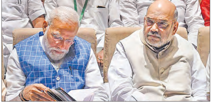
ବିଗତ କିଛି ଦିନ ହେଲା ସିଏଏ ଲାଗୁ ହେବା ନେଇ ବିଭିନ୍ନ ସ୍ତରରେ ସୂଚନା ମିଳିଥିଲା । ଗତ କାଳୁଆରାରେ କେନ୍ଦ୍ର ମନ୍ତ୍ରୀ ଶାନ୍ତନୁ ଠାକୁର ସିଏଏ ଲାଗୁ ହେବା ନେଇ ସୂଚନା ଦେବା ସହିତ ସମ୍ପ୍ରଦାୟ ମଧ୍ୟରେ ବିଜ୍ଞପ୍ତି ପ୍ରକାଶ ପାଇବ ବୋଲି କହିଥିଲେ । ଏହାର

ଆଗତ କରାଯିବା ପରେ ପ୍ରଥମେ ଏହାକୁ ଲୋକସଭାରେ ପାରିତ କରାଯାଇଥିଲା । ପରେ ପରେ ଏହି ବିଲ ରାଜ୍ୟସଭାରେ ପାରିତ ହେବା ସହିତ ସେହିବର୍ଷ ଡିସେମ୍ବର ୧୨ ତାରିଖରେ ରାଷ୍ଟ୍ରପତିଙ୍କ ଅନୁମୋଦନ ଲାଭ କରି ଆଇନରେ ପରିଣତ ହୋଇଥିଲା । ଏହାପରେ ସାରା ଦେଶରେ ସିଏଏକୁ ସମର୍ଥନ ଦେଖାଯାଇଥିଲା ବୋଲି ସରକାର କହିଥିଲେ । ଏହାକୁ ବିରୋଧ କରି ବିଭିନ୍ନ ମହଲରେ ବିବାଦ ଚଳିଥିଲା । ସେତେବେଳେ କେନ୍ଦ୍ର ସରକାର ସ୍ଥାୟୀ ନାଗରିକତା ଦେବା ଏହାର ମୁଖ୍ୟ ଉଦ୍ଦେଶ୍ୟ ରହିଛି । କେନ୍ଦ୍ର ସରକାରଙ୍କ ଦ୍ୱାରା ଏହି ବିଲ ୨୦୧୯ ଡିସେମ୍ବରରେ